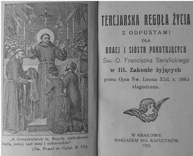
Il. 3. Strona tytułowa publikacji pt. Tercjarska reguła życia z odpustami dla braci i sióstr pokutujących Św. O. Franciszka Serafickiego w III. Zakonie żyjących przez Ojca Św. Leona XIII r. 1883 złagodzona, Kraków 1923

na temat tercjarstwa. Oto tytuły niektórych, drukowanych w rozmaitych czasopismach: Tercjarstwo jest prawdziwym zakonem , „Dyrektor III Zakonu” 1936, s. 93; Dodatni wpływ III zakonu , „Dyrektor III Zakonu” 1938, s. 67–69, 81–82; Praca tercjarzy w parafii , „Przegląd Katolicki” 1927, s. 151–153; Trzeci zakon a duszpasterstwo , „Dyrektor III Zakonu” 1931, s. 91–95.