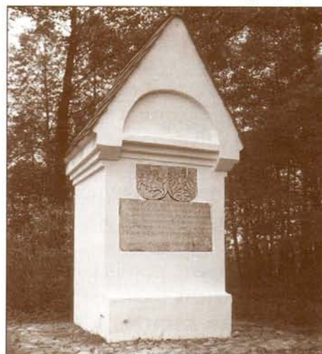
Пограничный столб на границе Литвы, Польши и Прусс, по соседству с деревней Простки и Богуши, на переправе через р.Элк, это место традиционно называют Каменный Брод. На столбе гербы трёх государств и таблица с надписью 1545 г.

Тыкотин и Василькув входили в состав собственного добра коро-