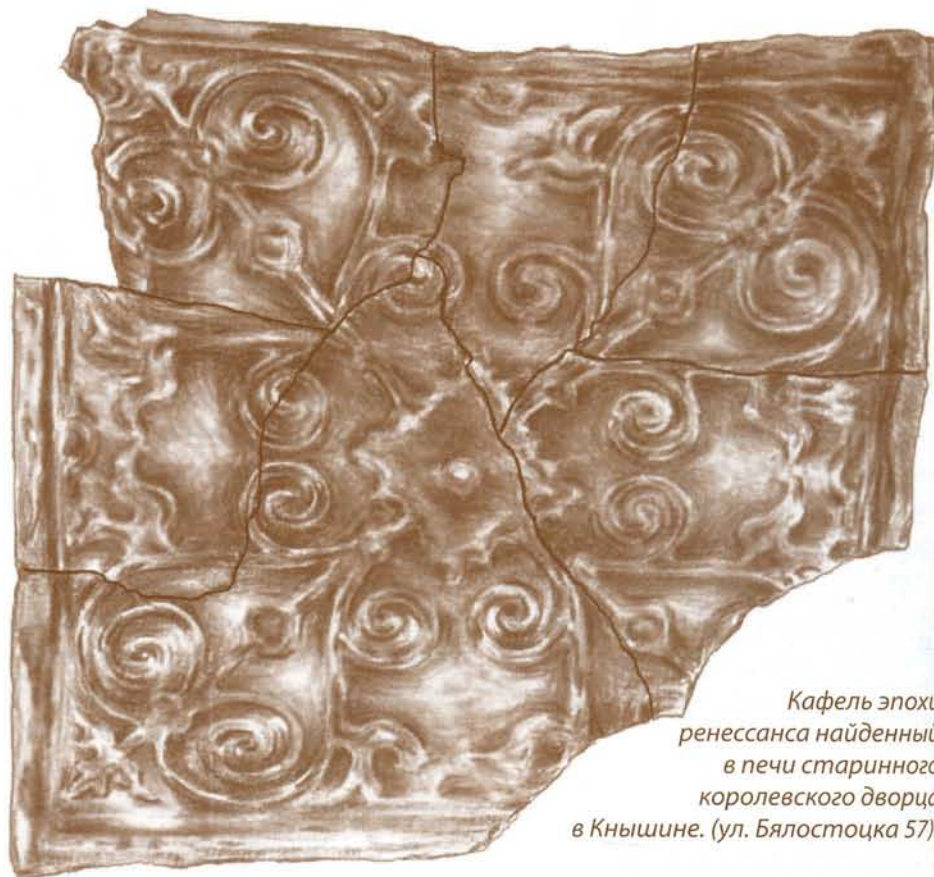
Кафель эпохи ренессанса найденный в печи старинного королевского дворца в Кнышине. (ул. Бялостоцка 57).

Число дней проведённых в Кнышине очень большое, благодаря частым визитам, а не постоянному пребыванию в замке. Частые назначения на должность в Кнышине указывают на то, что король Зигмунт Август предпочитал отдавать сенаторские кресла в наименее неудобных условиях. Это свидетельствует о том, что