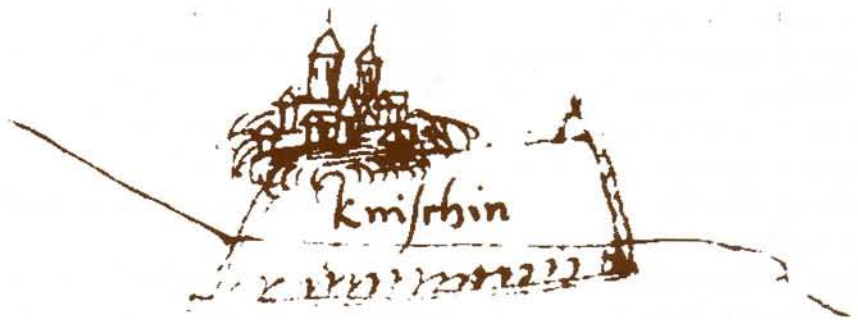
Вид Кнышина на карте 1536 г., дополненной в 1561 г. дорогой ведущей из Литвы в Корону, плотиной – Старой и Новой через долину Яскранки, большим забором вокруг территории пруда возле резиденции, зверинцем косуль, зайцев, а также конюшней и выгоном для коней. Библиотека Университета в Вильнюсе, ф. 23, ном. 135.