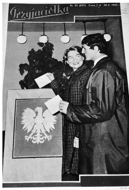
Przyjaciółka, nr 22, 1965