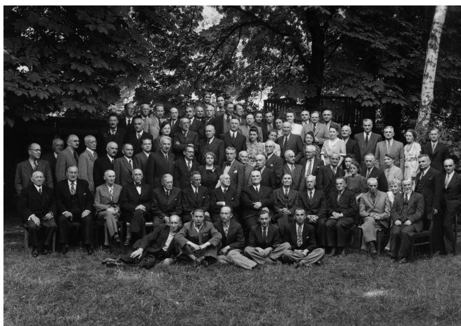
Zdjęcie sędziów i pracowników Izby Cywilnej SN. Warszawa, Ogród Pałacu Krasińskich 1939 r.