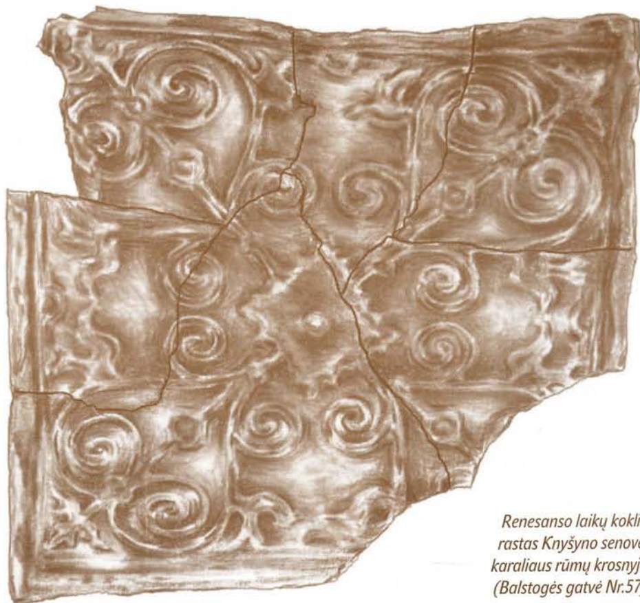
Renesanso laikų koklis, rastas Knyšyno senovės karaliaus rūmų krosnyje. (Balstogės gatvė Nr.57).

Aleksandras Gvaninis savo kronikoje „Sarmatae Europeae descriptio“ štai taip apibūdino rezidenciją Knyšyne: „Knyšynas