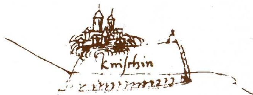
Knyšyno vaizdai 1536 metų žemėlapyje, papildytame 1561 metais: kelias iš Lietuvos į Karūną, užtvanka – Sena ir Nauja Jaskrankos slėnyje, tvora aplink kūdrą prie rezidencijos, stirnų ir kiškių žvėrynas, o taip pat arklidės ir ganykla. Vilniaus universiteto biblioteka, f.23, nr. 135