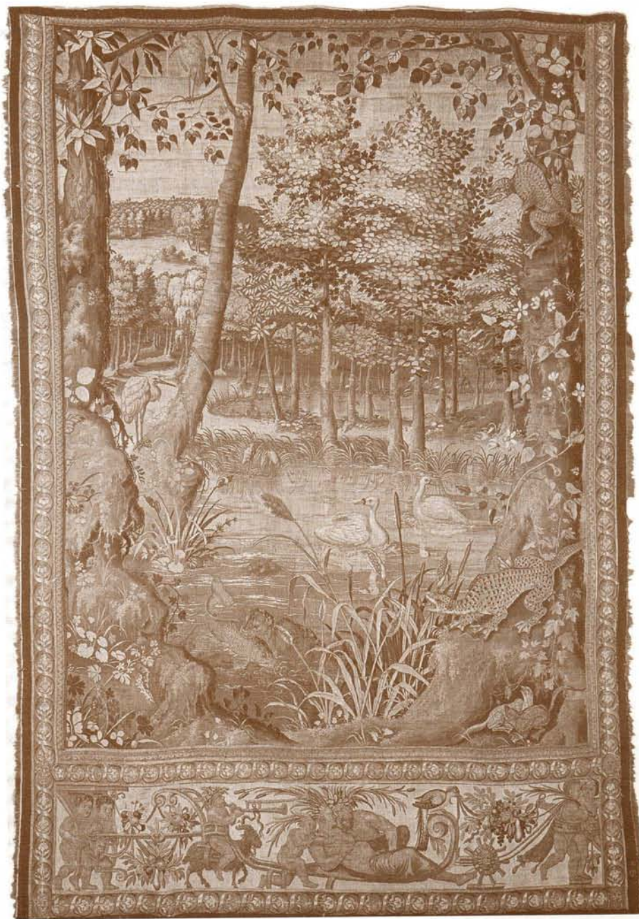
Gobelenas, kurį iki 1572 metų kabindavo Knyšyno rezidencijoje. Ūdra, gulbės, garniai ir fantastiniai ropļiai. Verdiūra su žvėrių atvaizdais. Nuotrauka „Photogravure De“ Schutter, Antwerpia. Flamiški gobelenai Vavelio karaliaus rūmuose. Red. J. Šablovskis, Varšuva 1975, 203 psl.

Važvineco Voinos dvaras – kanceliarijos raštvedžio ir jaunesniojo Lietuvos išdininko, Jano Dulskio