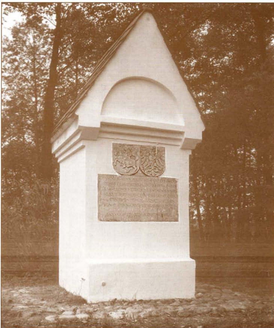
Lietuvos, Lenkijos ir Prūsijos pasienio stulpas prie Prostų ir Bogušų kaimelių esančios perkėlos per Elkos upę (tradiciškai šią upę vadina Akmeninė Brasta). Ant stulpų pavaizduoti trijų valstybių herbai ir lentelė su užrašu: „1545 metai“.

Šiaurėje Zigmanto Augusto teritorijos ribojosi su Karališkąja Prūsija, kuri tikėjosi paveldėti žemes iš Hohencolernų, o Karališkosios Prūsijos teritorija priklausė monarchui. Galima buvo manyti, kad laikui bėgant jos priklausys Zigmantui. Iki 1525 metų ši siena