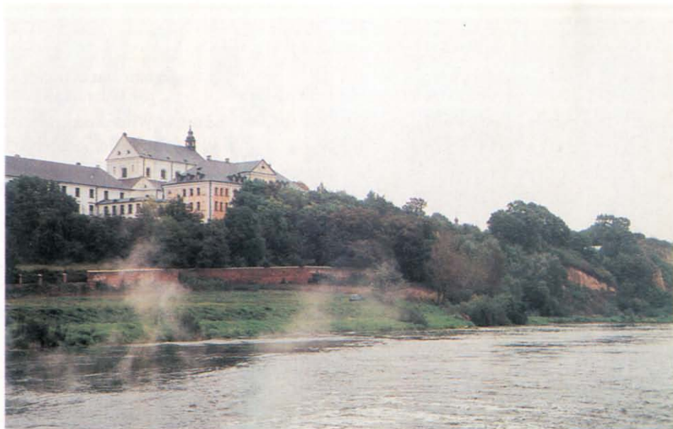
Drohiczyn. Widok z Bugu na kościół katedralny.

Fot.: W. Wilczewski, 1995. Ze zbiorów Regionalnego Ośrodka Studiów i Ochrony Środowiska Kulturowego w Białymstoku.