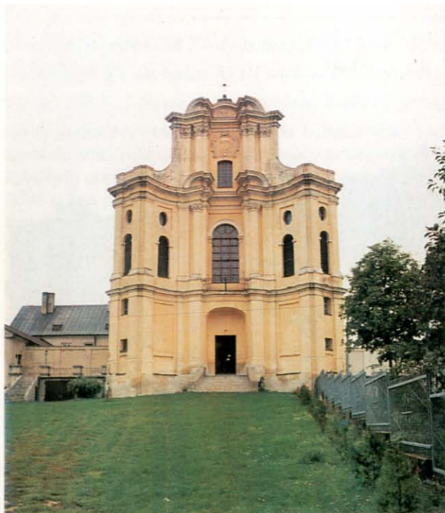
Drohiczyn. Kościół benedyktynek. Fot.: W. Wilczewski, 1995. Ze zbiorów Regionalnego Ośrodka Studiów i Ochrony Środowiska Kulturowego w Białymstoku.