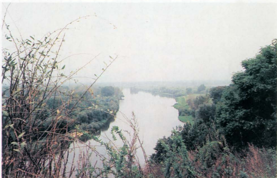
Drohiczyn. Widok z Góry Zamkowej na Bug.

Fot.: W. Wilczewski, 1995. Ze zbiorów Regionalnego Ośrodka Studiów i Ochrony Środowiska Kulturowego w Białymstoku.