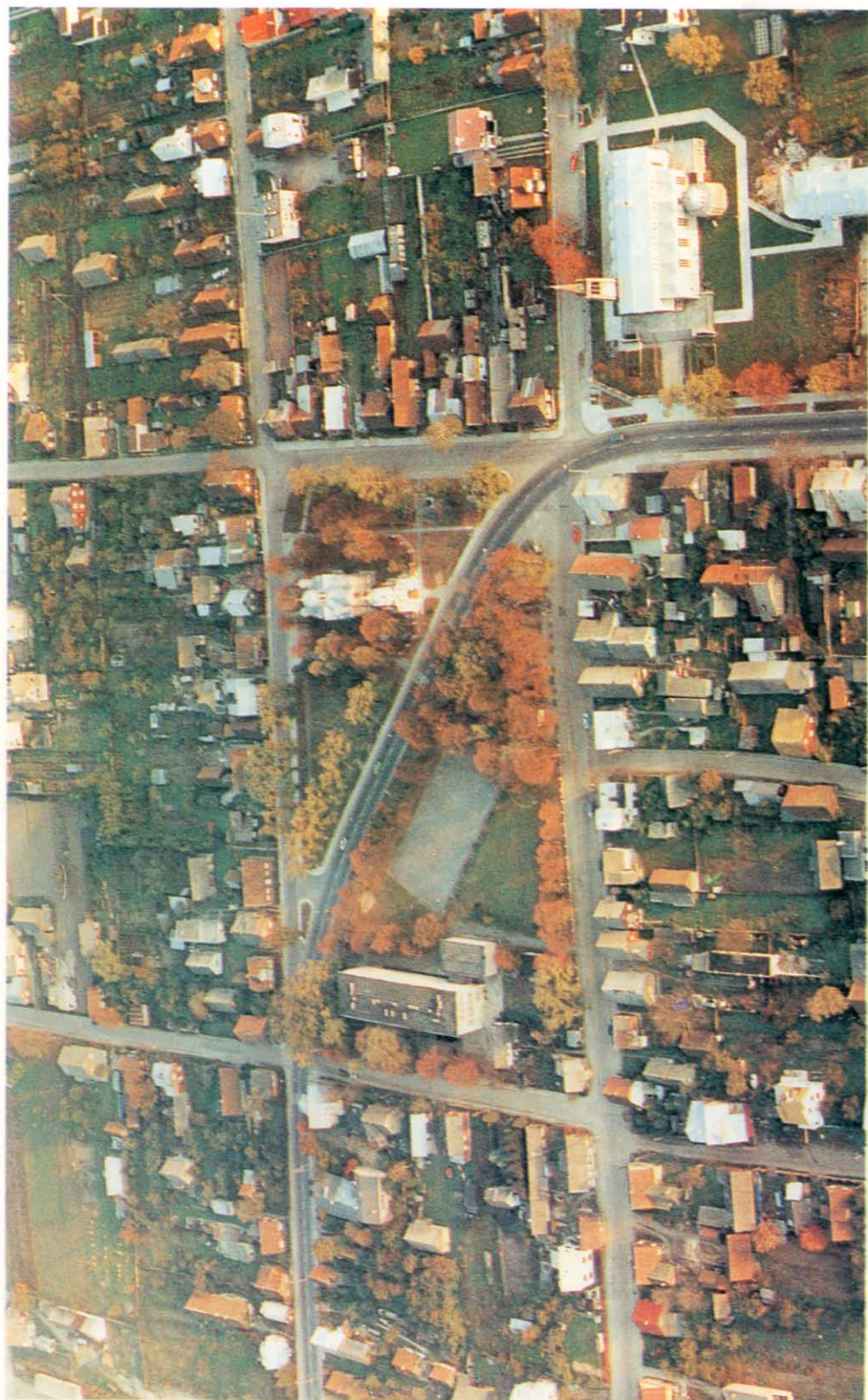
Wasilków. Fot: W. Stępień, 1993. Ze zbiorów Regionalnego Ośrodka Studiów i Ochrony Środowiska Kulturowego w Białymstoku.