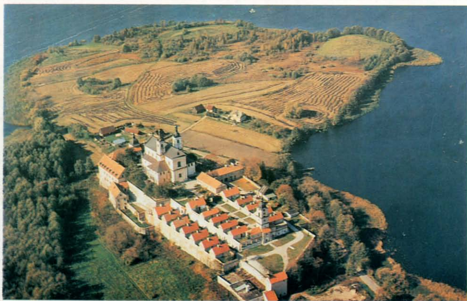
Wigry. Klasztor kamedulów. Fot.: W. Stepień, 1993. Ze zbiorów Regionalnego Ośrodka Studiów i Ochrony Środowiska Kulturowego w Białymstoku.