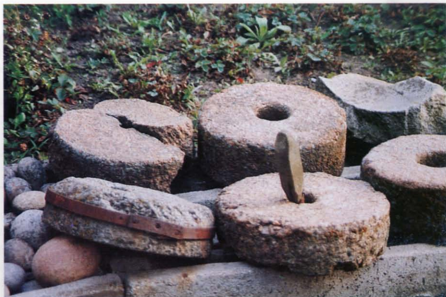
Fot. 5 Zbiór żaren w Muzeum Społecznym w Surażu. Fot W.F. Wilczewski, 1995