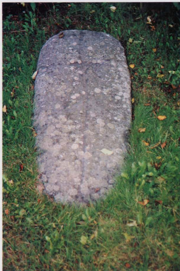
Fot. 6 Płyta nagrobna średniowiecz- na z rytym krzyżem łacińskim. Fot W.F. Wilczewski, 1995