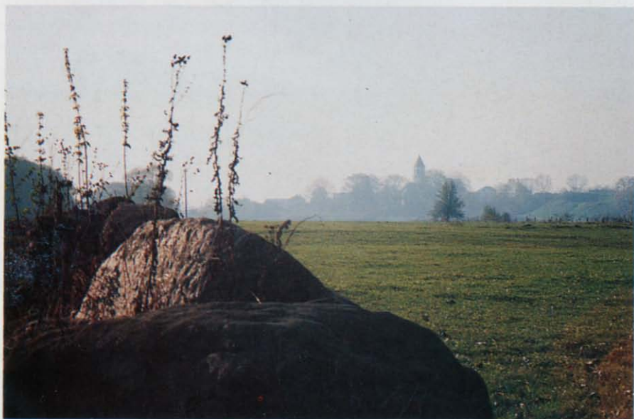
Fot 4 Widok Suraza z "gościńca bielskiego" Fot W.F. Wilczewski, 1995