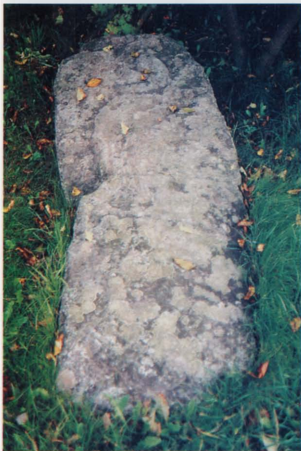
Fot. 8 Płyta nagrobna, śred- niowieczna z rytym półksiężycem Fot W.F. Wilczewski, 1995