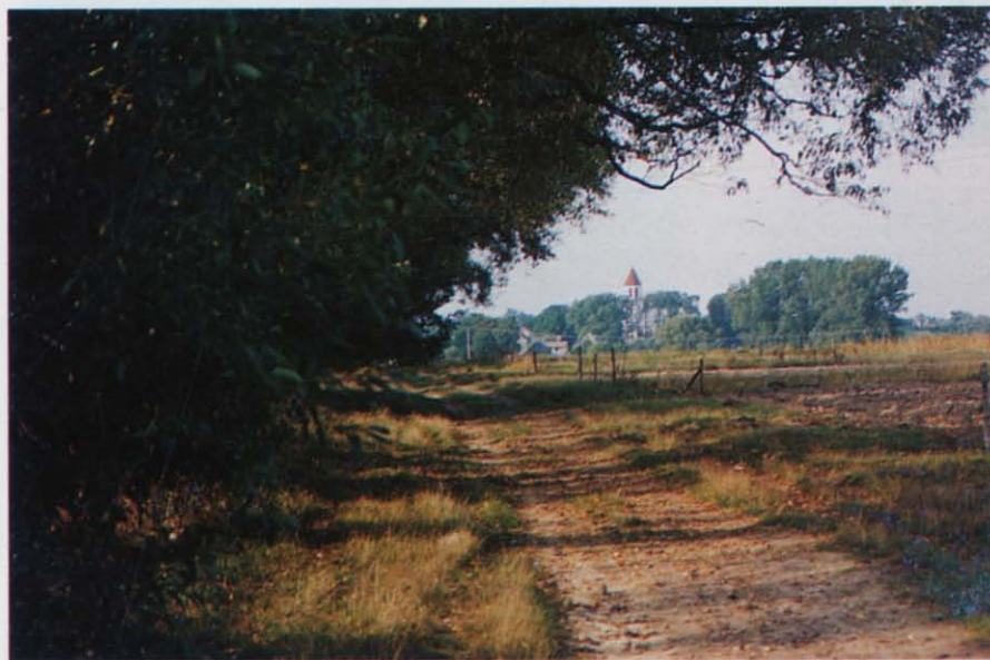
Fot 2 Droga z Piszczewa do Rynku Kościelnego przedłużenie dawnej ulicy Lackiej . Fot W.F. Wilczewski, 1995