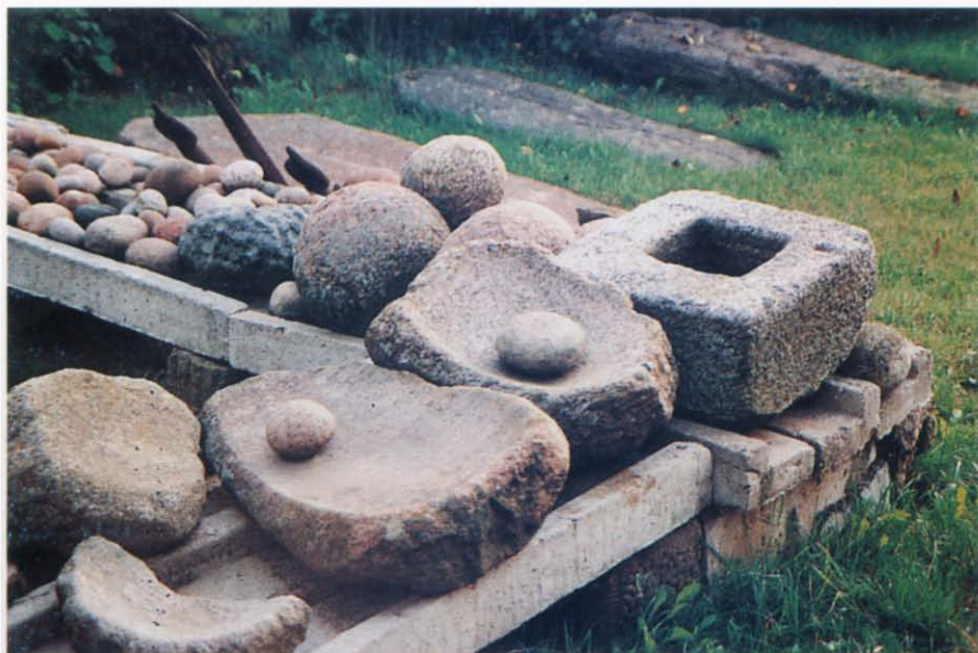
Fot. 7 Zbiór żaren w Muzeum Społecznym w Surazhu. Fot W.F. Wilczewski, 1995