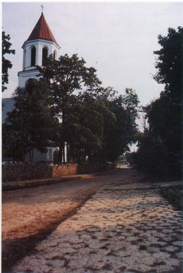
Fot. 3 Dawna ulica Lacka u wylotu na Rynek Kościelny. Fot W.F. Wilczewski, 1995