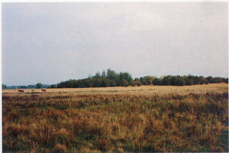
Fot. 1 Uroczysko Piszczewo wśród bagiennych łąk nad Narwią Fot. W.F. Wilczewski, 1995