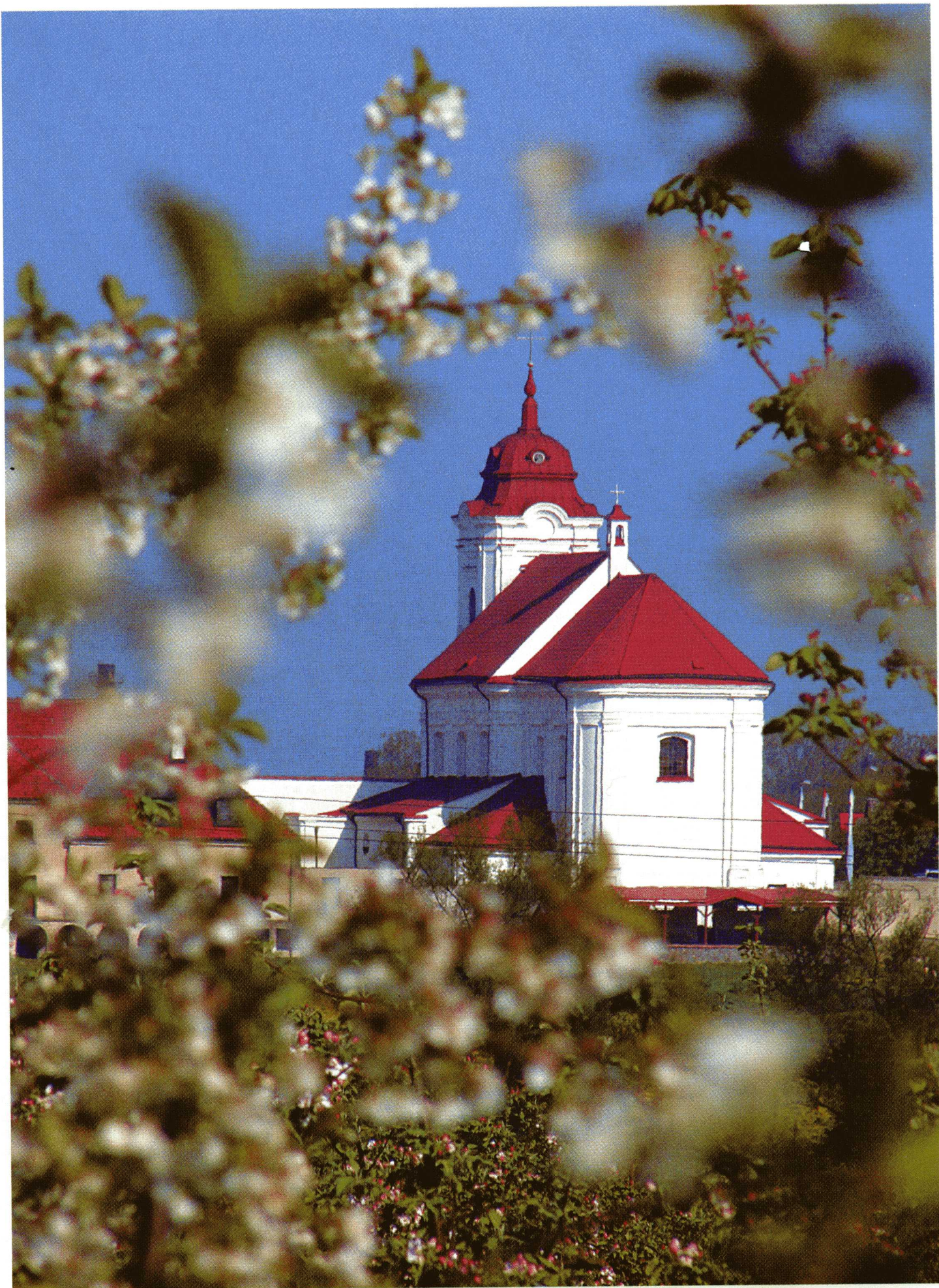
Kościół w Choroszczy wiosną