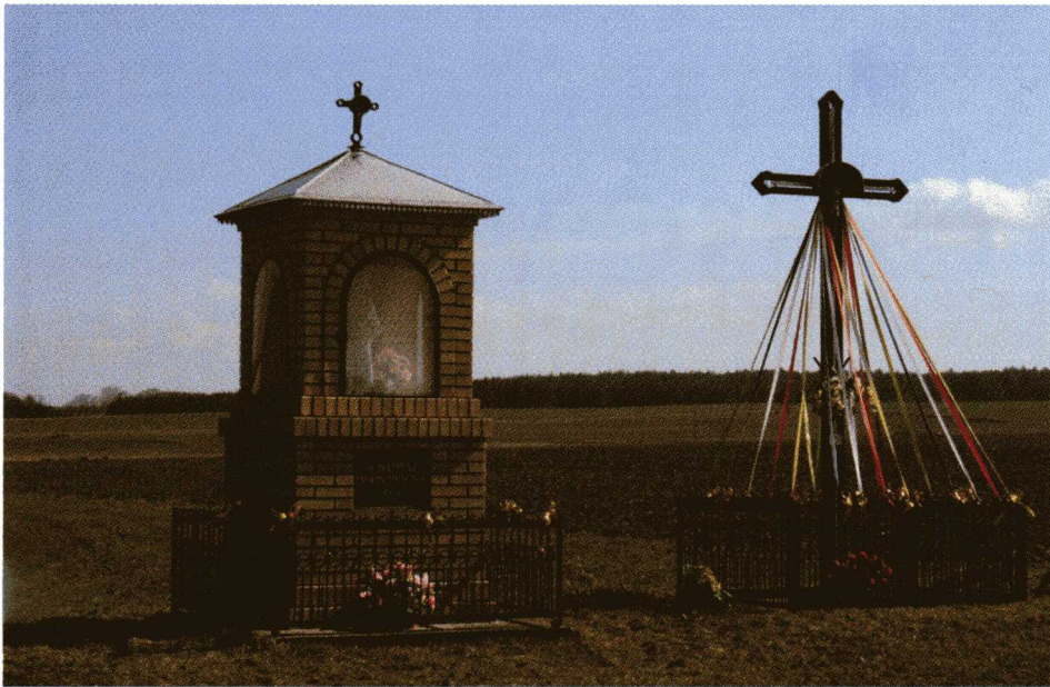
Kapliczka św. Mateusza patrona wsi Mroczki