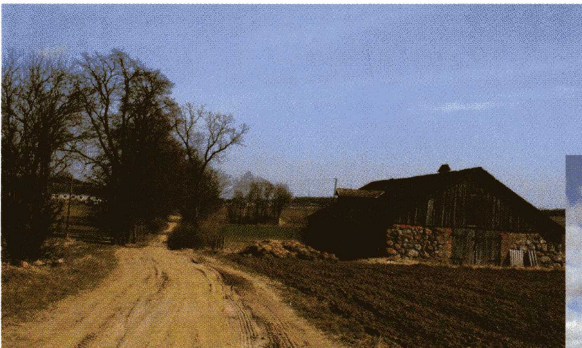
Zabytkowa alejka i pozostałość Dworu Mroczki