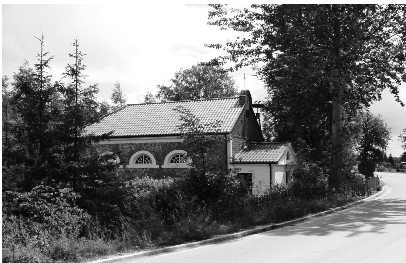
Królowy Most. Kościół pw. św. Anny. Elewacje północna i zachodnia. Widok od strony wsi Kołodno, fot. Izabela Szymańska, 2004.