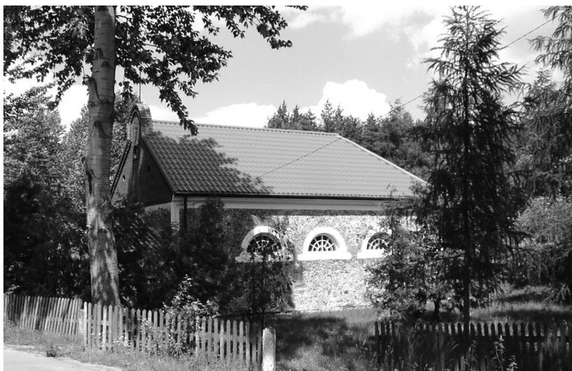
Królowy Most. Kościół pw. św. Anny. Elewacje południowa i zachodnia, fot. Izabela Szymańska, 2004.