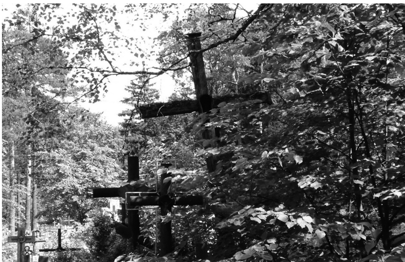
Królowy Most. Stare drewniane krzyże na cmentarzu założonym przez Jakuba Sakowicza, fot. Izabela Szymańska, 2004.