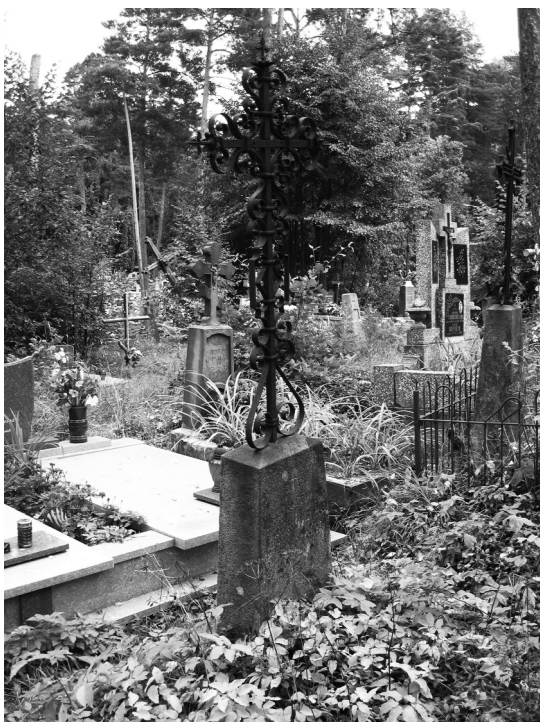
Królowy Most. Cmentarz katolicki i prawosławny, fot. Izabela Szymańska, 2004.