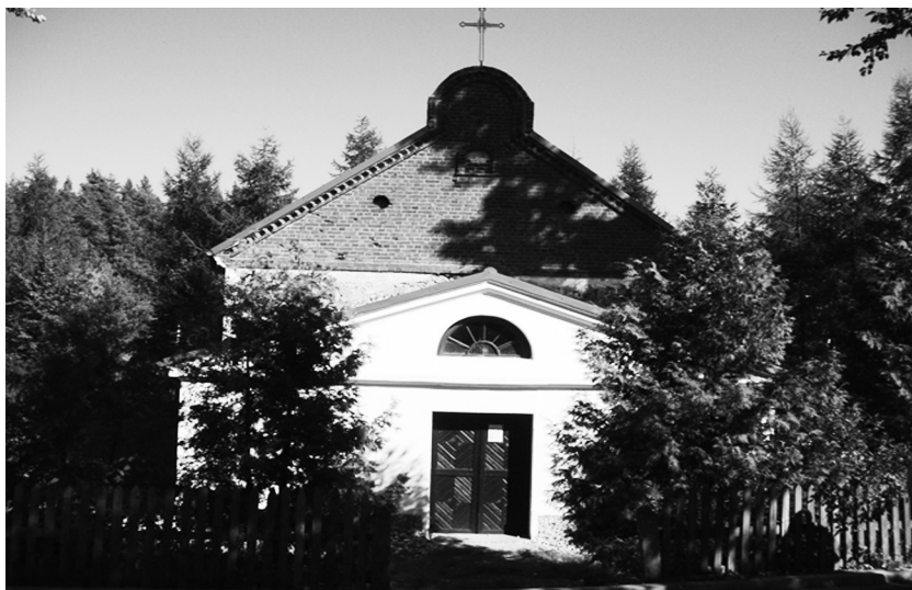
Królowy Most. Kościół pw. św. Anny. Elewacja zachodnia. Kruchta, fot. Izabela Szymańska, 2004.