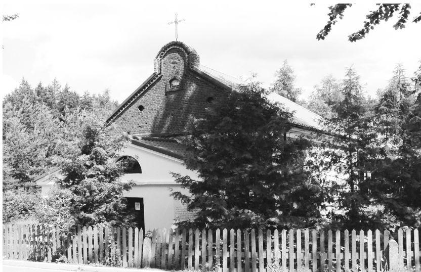
Królowy Most. Kościół pw. św. Anny. Kruchta i wejście do kościoła, fot. Izabela Szymańska, 2004.