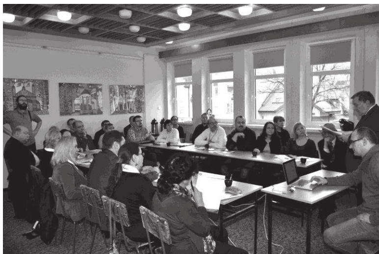
Drugi dzień obrad (Sokółka)