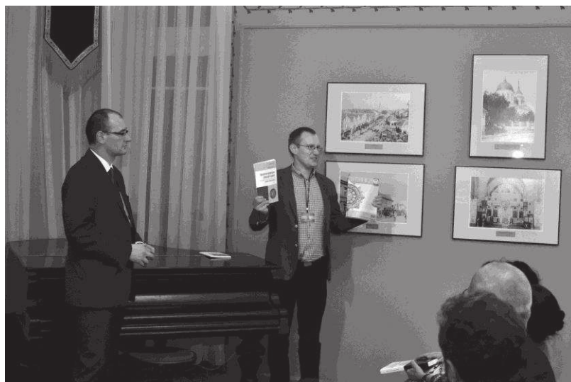
Promocja wydawnictw naukowych z Tatarstanu w Muzeum Historycznym w Białymstoku

In the opinion of the participants, the conference turned out to be a valuable initiative and a first-time opportunity to join together various branches of the humanities and social studies, which for some time were dealing with Tatar literature independently, within their respective fields. During the conference the specialists in Polish literature, Slavic studies, Oriental studies, historians and sociologists came up with interesting study results and research hypotheses. Concluding the event, they all agreed that thorough studies on Tatar literature should be continued in a similar comparative and interdisciplinary vein.