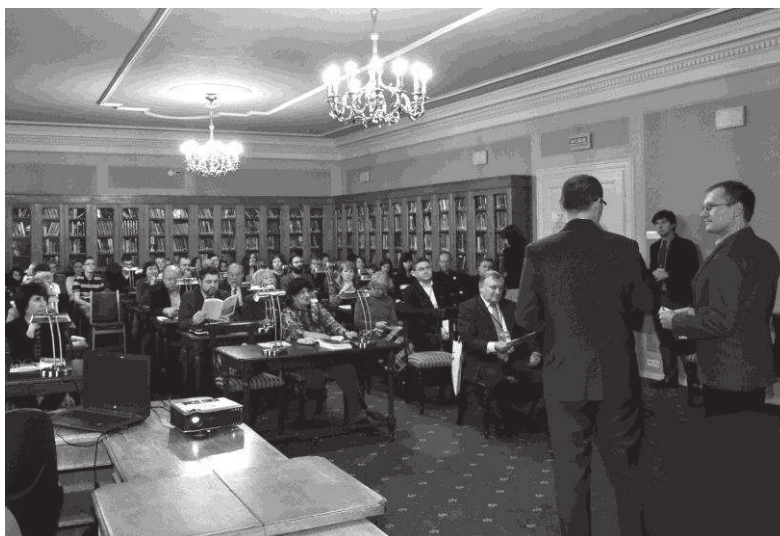
Pierwszy dzień obrad w Książnicy Podlaskiej