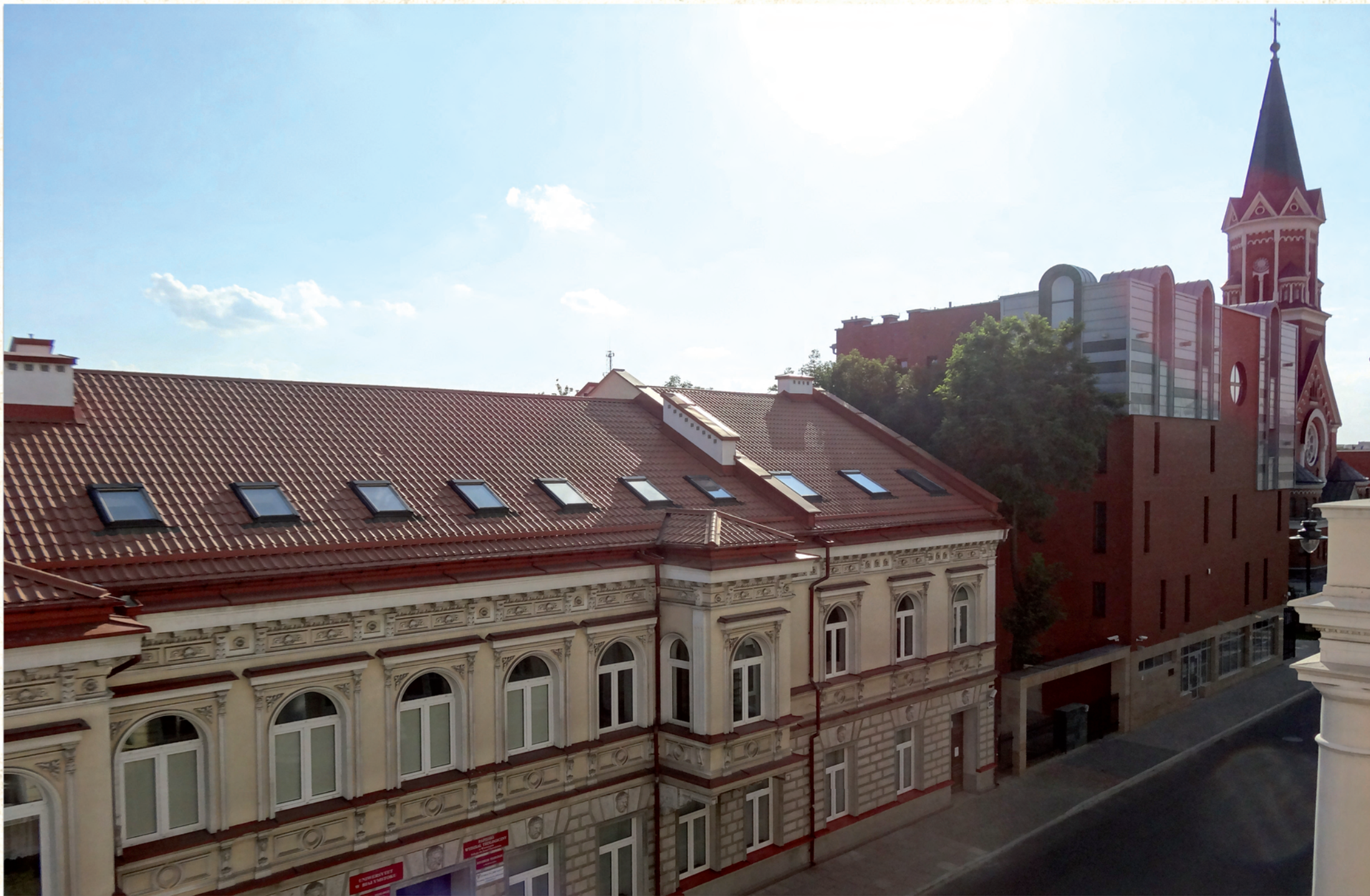
Siedziba Studium Teologii w Białymstoku w sąsiedztwie Archiwum i Muzeum Archidiecezjalnego oraz kościoła pw. św. Wojciecha