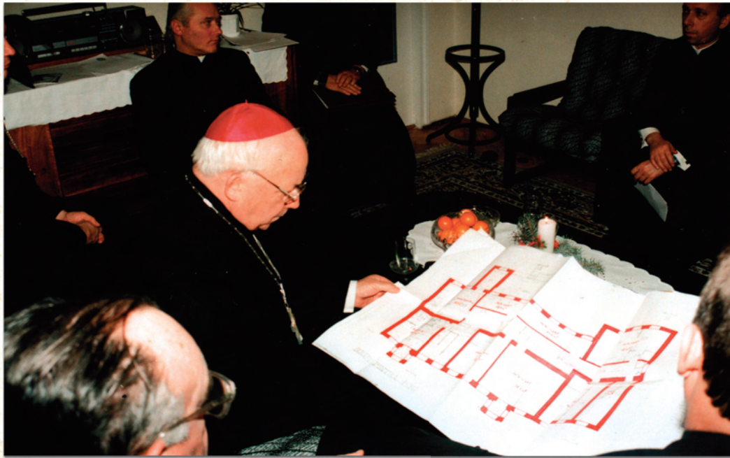
Rozmowy w sprawie adaptacji budynku przy ul. Warszawskiej 50, 31 stycznia 1996 roku