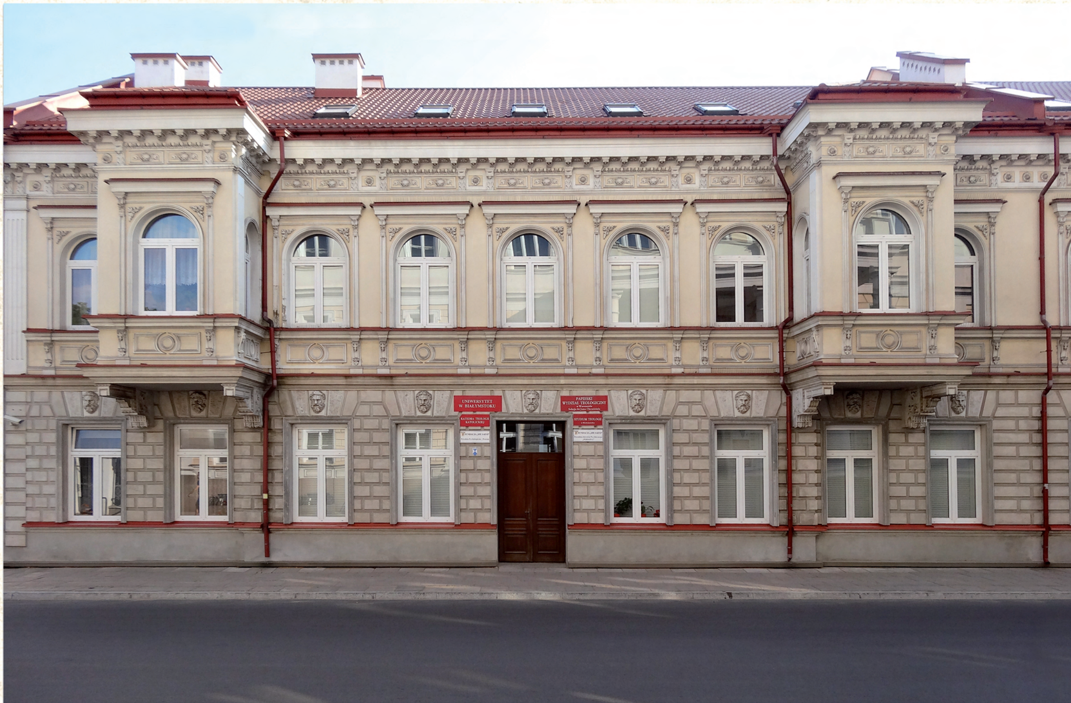
Siedziba Studium Teologii w Białymstoku przy ul. Warszawskiej 50