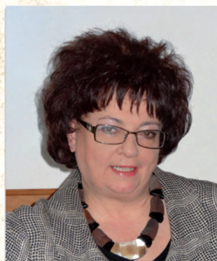
Mgr Alicja Bienkowska (od 2011)