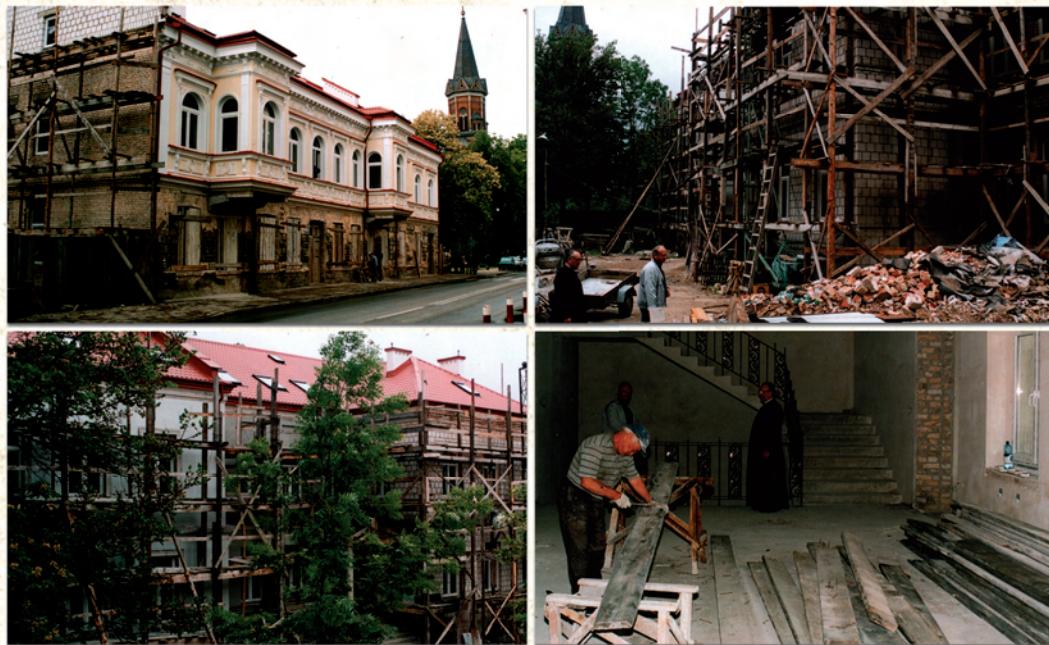
Siedziba Studium Teologii w Białymstoku w trakcie remontu