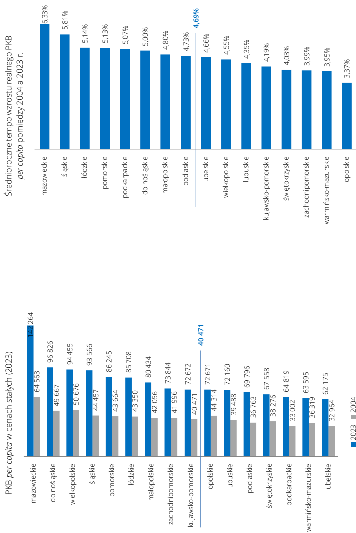
Poziom i dynamika zmian PKB per capita w polskich województwach w latach 2004–2023