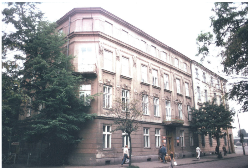
Rodzinna siedziba Mikosiów, ul. Dworcowa 9, Tarnów, 1939 r.

[JŁ] Zostali architektami, mieli uzdolnienia architektoniczne, tak dziś byśmy je nazwali.