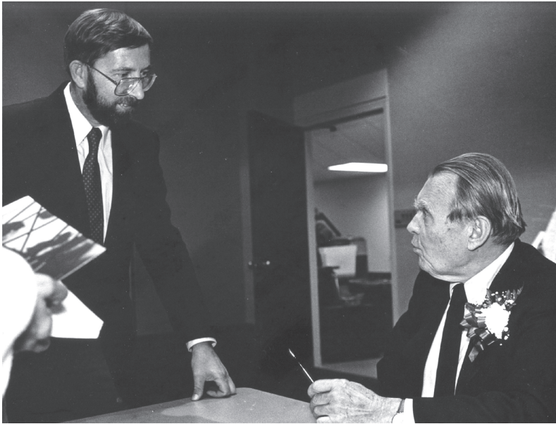
Z Czesławem Miłoszem, Milwaukee, 1991 r.

Zajęcia uniwersyteckie na UWM zacząłem od języka polskiego, literatury i kultury oraz wspólnych seminariów z kolegami językoznawcami. Badania naukowe zacząłem od prac językoznawczych, tych które miałem jeszcze z Brown University. Niespodziewanie, już w 1978 roku, pojawiły się na naszym uniwersytecie zbiory Amerykańskiego Towarzystwa Geograficznego (AGS) z Nowego Jorku. Składają się na nie bezcenne materiały, które nowojorscy politycy, filantropi, geografowie i historycy zbierali w XIX i XX wieku w celu prowadzenia polityki międzynarodowej, eksploracji Arktyki, Antarktyki i Ameryki Łacińskiej oraz licznych ekspedycji. Budynek AGS stał blisko Harlemu i istniało zagrożenie, że będą tam pożary, a AGS nie mogło opłacić kosztów ubezpieczenia tych wspaniałych kolekcji. W 1974 roku Pani profesor