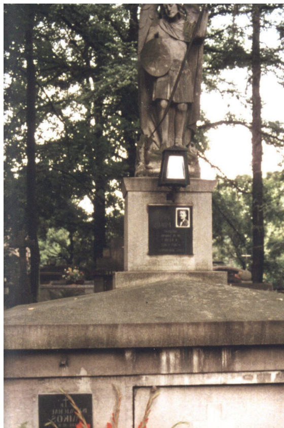
Rodzinny grobowiec Mikosiów, Stary Cmentarz, Tarnów.

była pełna i niedemonstracyjna. Matczyna była spontaniczna i gorąca. I to dzięki nim czuliśmy się bezpieczni i mogliśmy znaleźć swoją drogę życiową.