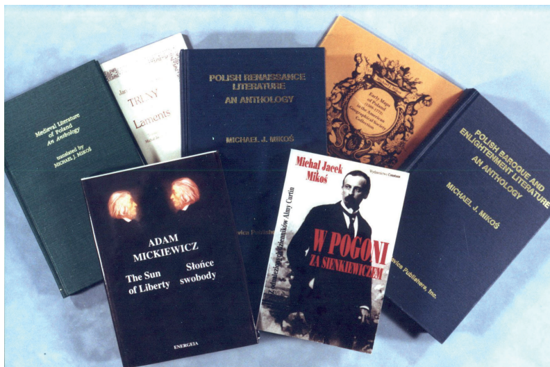
Kilka książek, 1999 r.