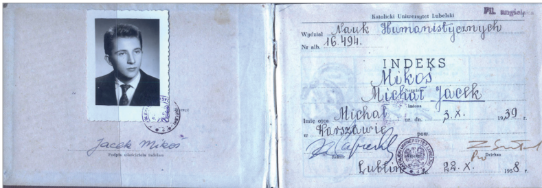
Student pierwszego roku KUL, 1958 r.

[JL] W ogóle w Twojej biografii widać ciągłe zmiany. Tarnów, potem Łódź, Gdynia, znowu Tarnów, Racibórz. Trafiasz do Lublina na studia, wybór KUL-u wydaje mi się naturalny w Twoim przypadku, chociaż anglistyka już zdaje mi się mniej oczywista. Dlaczego anglistyka i jak Twe studia wtedy wyglądały?