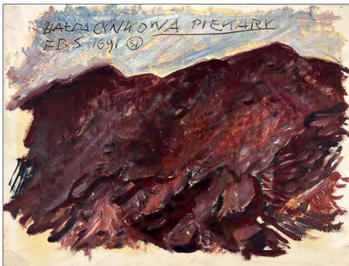
Franciszek Starowieyski: Hałda cynkowa w Piekarach

Skąd ten zachwyty? Gdzie szukać źródeł takiego ukształtowania estetyki? Odpowiedź być może znajduje się u Zygmunta Glogera, który w Dzienniku podróży po Niemnie w podobny sposób zachwyca się kopalnią wapna zwaną Miołą lub Mielawcem (od mialu wapiennego). Pisze: