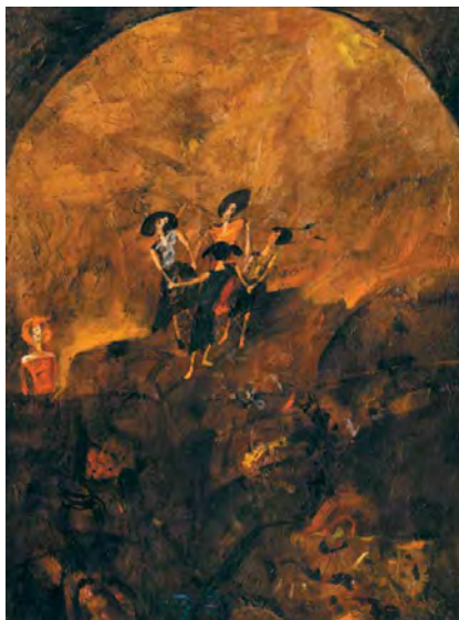
Witold Pałka, Zabawa na hałdzie

Na szczycie hałdy widać cztery kobiece postacie, trzymające się za ręce i tańczące w kole. Można by pozostać przy do-