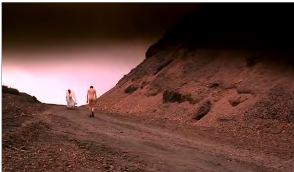
Kadr z filmu Angelus , reż. Lech Majewski, 2001

fa – nadciągający z Saturna promień. Co więcej, historia lat 1939–1955 zostaje odczytana przez górników-teozofów jednoznacznie: wybuch wojny, „czerwona zaraza” i wielki grzyb potwierdzają zapowiedź ostatecznego zniszczenia. Ratunkiem dla ludzkości jest całkowite oczyszczenie się z grzechu lub ofiara z niewinnego młodzieńca. Do tego zadania wybierają Rudolfa, czystego młodzieńca, który jako niewinny przyjmie na siebie uderzenie, poświęcając własne życie. Aby to się dokonało, Rudolf musi wejść na górę, która okazuje się hałdą. To właśnie na kamiennym wzgórzu pełnym odpadów i tłącego się żaru ma dokonać się ostateczna ofiara. W drodze na szczyt Rudolfowi towarzyszy anioł, wyraźnie wskazując na powinowactwo sceny z biblijną ofiarą Izaaka.