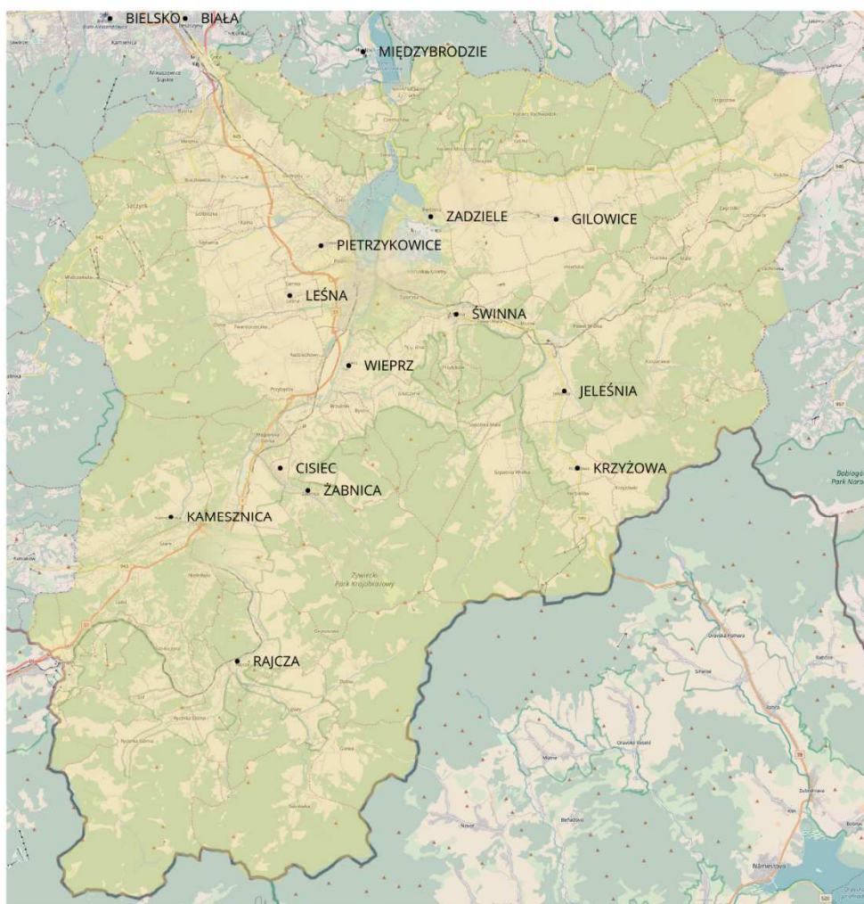
MAPA 1: Miejscowości, z których pochodzili mistrzowie cechów żywieckich w badanym okresie

Niekiedy też pełne członkostwo stawało się udziałem kobiet z różnych środowisk, zwłaszcza zaś wdów po mistrzach 3494 . Dochodziło do tego zwykle drogą ich wykupienia do danej formacji na prawach mistrza/brata 3495 , bywa, że na kolejny już stopień, licząc od tego, osiągniętego przez zmarłego męża 3496 . Szczegółowo zagadnienie przyjęć wdów omówione zostało w rozdziale o działalności samopomocowej cechów.