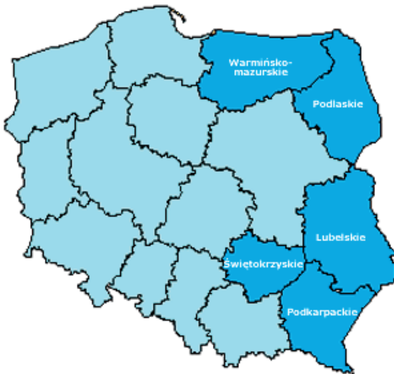
Rycina 1. Województwa objęte programem Rozwój Polski Wschodniej