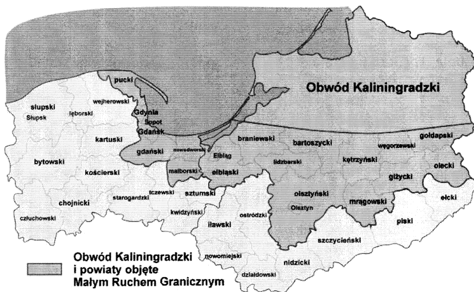
Rysunek 2. Obszar małego ruchu granicznego z Rosją