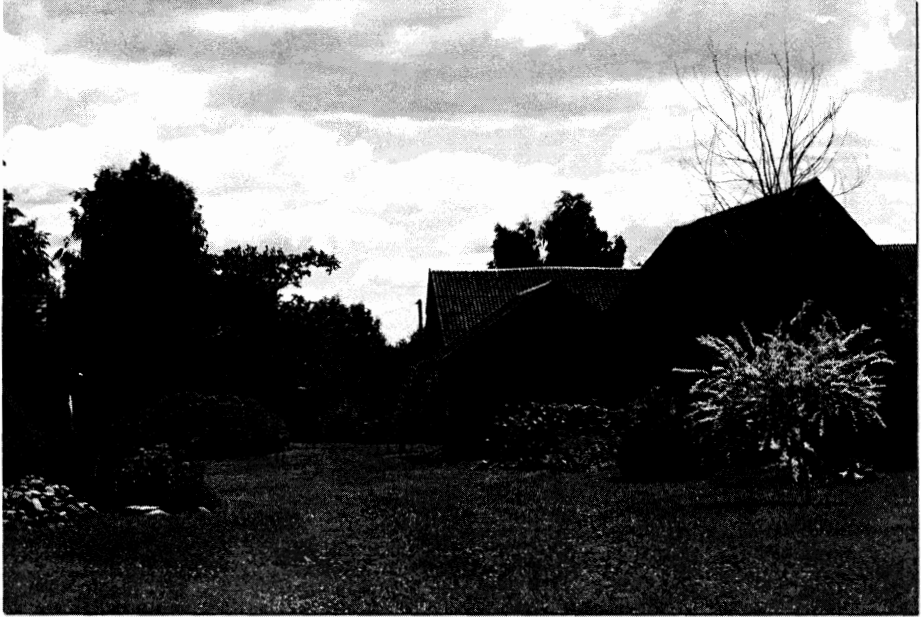
Fotografia 2. Założenie ogrodowe w stylu angielskim (Klewinowo)