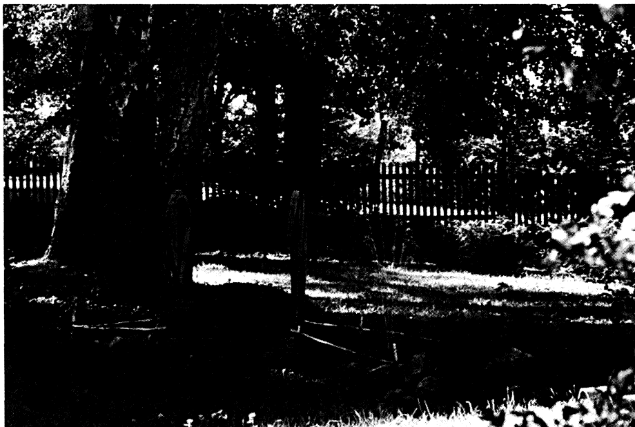
Fotografia 4. Mostek (Kruszyniany)