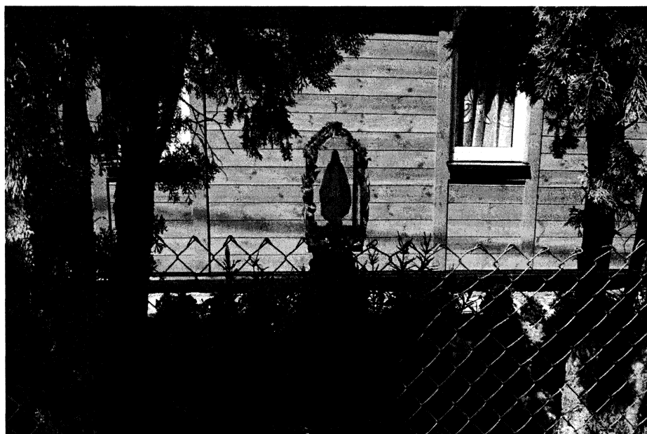
Fotografia 8. Kapliczka z figurą Matki Boskiej (Klewinowo)