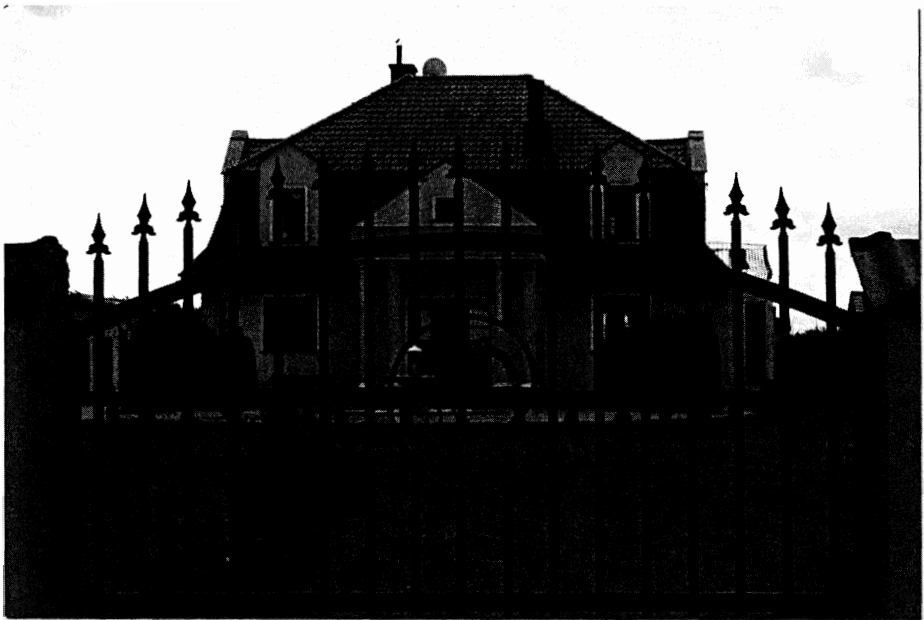
Fotografia 3. Założenie ogrodowe nawiązujące do stylu francuskiego (Szerenosy)