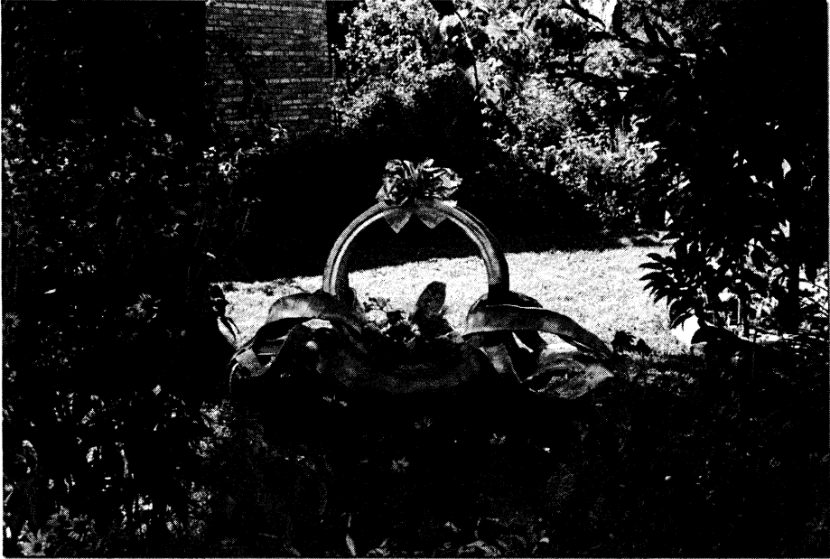
Fotografia 5. Koszyczek ze starej opony (Suraż)