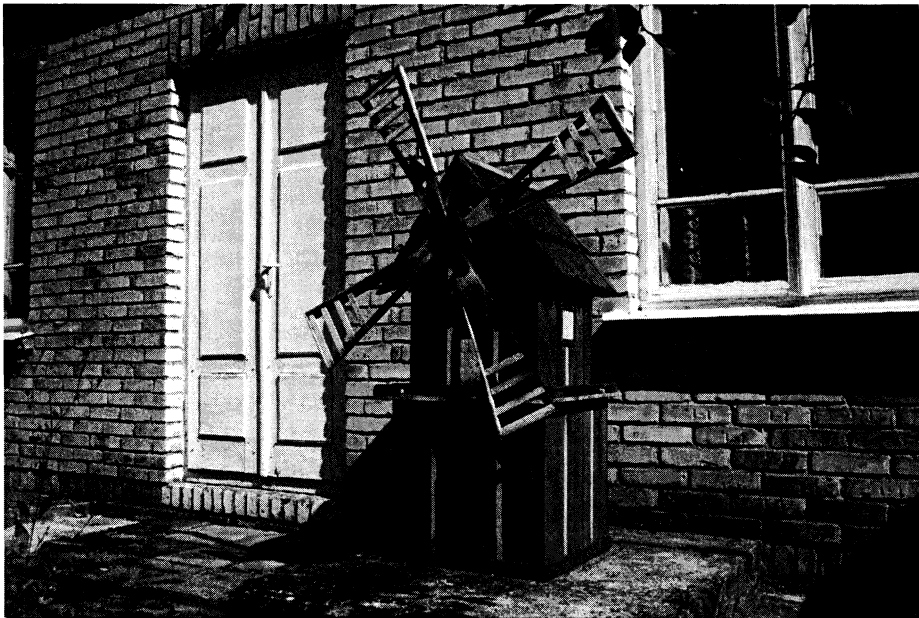
Fotografia 6. Wiatrak (Suraż)