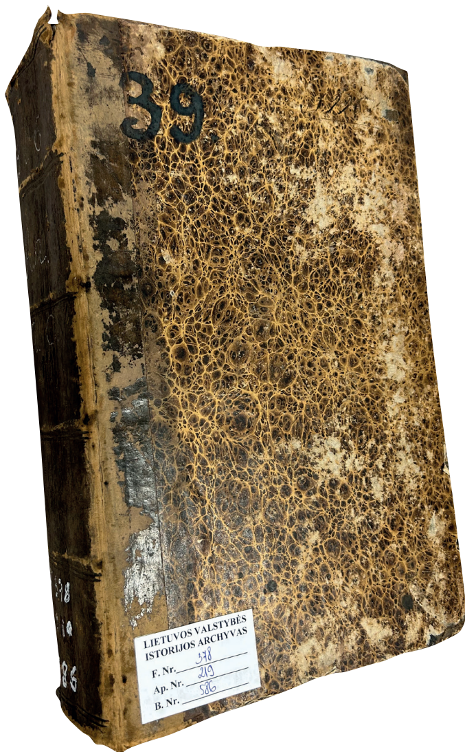
Il. 1. Poszyt liczący 416 stron, z nazwiskami 570 uczestników Powstania Listopadowego z Obwodu Białostockiego, Litewskie Państwowe Muzeum Historyczne w Wilnie