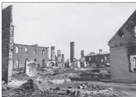
Zambrów, spalony dom gminy żydowskiej 43

Niemiecka propaganda oskarżała Żydów w Białymstoku jako współtwórców i organizatorów sowieckiej władzy w mieście i Regionie. Dlatego po jego zajęciu rozkazali im usunięcie wszystkich jej relikwów. Musieli oni strącać z miejskich cokołów ustawione tam posągi Włodzimierza Lenina (1870–1924), Józefa Stalina (1878–1953), symbole czerwonej gwiazdy, zrywać transparenty wychwalające komunizm. W dalszych działaniach, wzorowanych na praktykach z terenów okupowanego do 1941 roku GG, Niemcy ponownie przystąpili do pacyfikacji żydowskiej społeczności miasta. Kolejne akcje w Regionie również przyniosły mordowanie Żydów, grabieże ich mienia i palenie synagog.