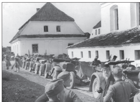
Synagoga w Tykocinie 17