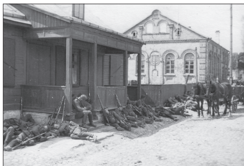
Synagoga w Knyszynie 13