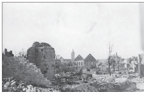
Dąbrowa Białostocka, spalona Synagoga 41