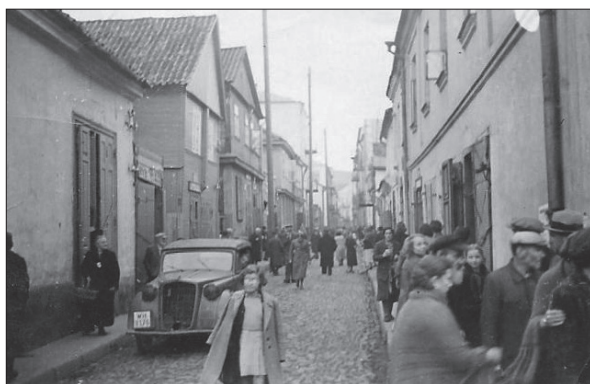
Białystok, dzielnica Chanajki 11