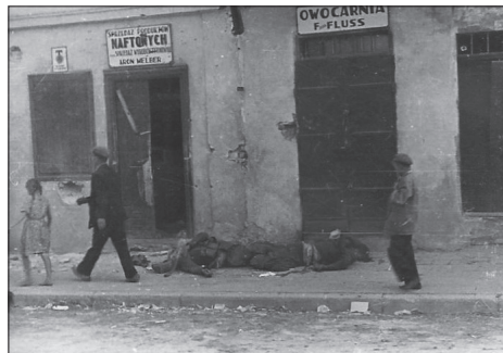
Wasilków, Żydzi zabici na ulicy