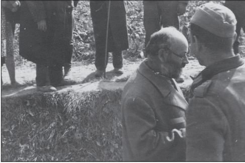
Żydzi wchodzący do dołów śmierci