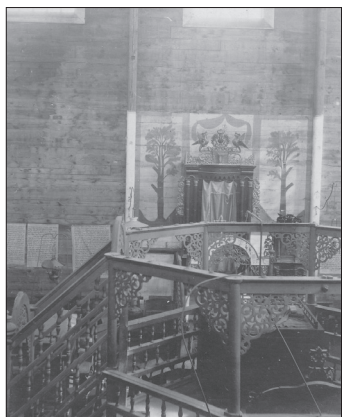
Raków, wnętrze drewnianej Synagogi 9