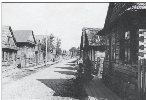
Białystok (Region), społeczność żydowska