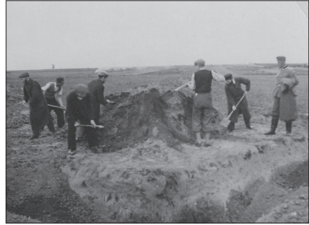
Żydzi zasypują doły śmierci