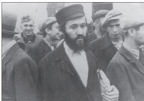
Białystok, „podczłowiek”, typ wschodniego Żyda

mieckich obiektywach. Dokonane przez Niemców od września 1939 roku zapisy fotograficzne (prezentowane w artykule) stały się niemy i ważnym źródłem archiwalnym. Ikografia ta po części przybliży obraz enklawy białostockich Żydów w mieście i Regionie, ale również relacjonuje codzienność utworzonego tam później getta. Autor jak w kalejdoskopie przedstawia zdjęcie po zdjęciu – w trakcie działań wojennych z września 1939 roku i od czerwca 1941 roku do końca enklawy w sierpniu 1943 roku. Wszystkie fotografie zostały uzupełnione merytoryczną treścią, wprowadzającą czytelnika w świat ostatnich dni świata utraconego. W całej gamie umieszczonych poniżej zdjęć dostrzeżemy dwa obrazy – ten, którego wojna jeszcze nie naruszyła, oraz ten, który zmierza ku końcowi. W scenach ujętych w kadrach niemieckich aparatów zauważymy dobór osób i miejsc, zgodnych z ideologicznym oraz światopoglądowym ukształtowaniem młodych żołnierzy. Na prezentowanych poniżej