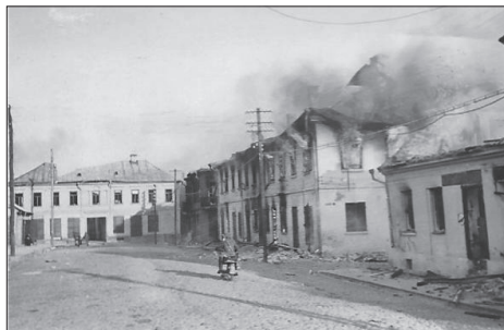
Białystok, Powstanie w getcie

no i mordowano na każdym rogu, Niemcy dokonywali zapisu ikonograficznego. Wprawdzie nie zachowało się go wiele, niemniej w tej małej jego części unaocznia on tragedię tamtych dni.