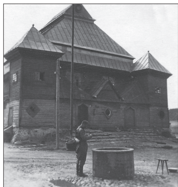
Piaski, woj. grodzieńskie, synagoga przed spaleniem 44