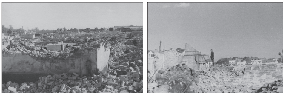
Białystok, ruiny dzielnicy i getta

spędzano z całego getta na plac obok rampy kolejowej, którą Niemcy otoczyli potrójnym kordonem 137 . W sumie przy życiu pozostało jeszcze 30 tys. osób 138 . Z całego getta na miejscu pozostawiono jedynie zdolnych do pracy około 1200 osób. Z tej grupy oddzielono potem 200 mężczyzn i 134 kobiet, których wysłano transportem do obozu w Stutthofie 139 . W tych tragicznych dniach nie do opisanania była tzw. kolejna „akcja dziecięca”. Niemcy nakazali wszystkie dzieci odtransportować z powrotem do getta, lecz na tą wiadomość nie wszyscy się na to godzili. Zwłaszcza że cała akcja była nie do zaakceptowania dla rodziców zmuszanych do oddania własnych dzieci 140 . Friedel informował i uspokajał, że dzieci zostaną wymienione na jeńców wojennych. W sumie odebrano 1200 dzieci, a wraz z nimi pozostało 40 osób w charakterze opiekunów. Jak się później okazało, dzieci pojechały specjalnym transportem do Czech, do obozu w Terezynie 141 .