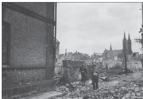
Spalona i zniszczona dzielnica Schulhof