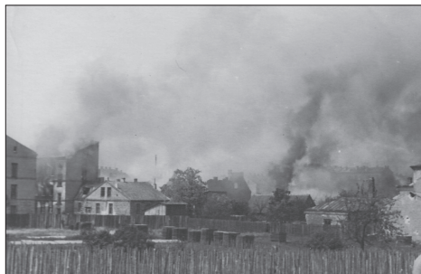
Białystok, Powstanie w getcie