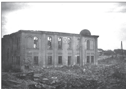
Białystok, spalona Wielka Synagoga