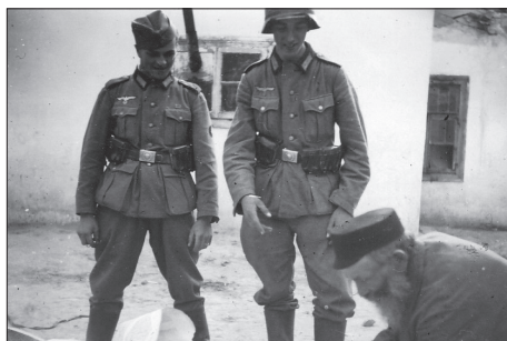
Żydzi z Suchowoli, palenie Tory

niemieckich oprawców. Spora ich część miała najpierw miejsce na obszarze przedwojennego województwa białostockiego: w Jedwabnem, Radziłowie, Goniądzu, Suchowoli, Szczuczynie, Trzciannem i Radziwiłowie, a następnie rozlały się na wiele innych miejscowości. Wówczas zamordowano lub spalono żywcem 20 tys. osób 37 . Uwadze oprawców hitlerowskich nie uszła też architektura synagogałna – palono Synagogi wraz z ich artefaktami sztuki judaistycznej, kahały 38 , niszczone chedery 39 , domy i mieszkania żydowskie. Latem 1941 roku Niemcom udało się doszczętnie zlikwidować większość żydowskich skupisk w rejonie Puszczy Białowieskiej oraz wzdłuż granicy Prus Wschodnich. Napotkanych ponownie poniżano, bito, obcinano brody, zabijano, a akty te młodzi żołnierze dokumentowali w zapiśach fotograficznych. Ogółem zamordowano od 40 do 50 tys. osób. W tym okresie agresorzy utworzyli w Regionie ponad 90 gett, w których scentralizowali ok. 250–300 tys. Żydów 40 . Poniżej autor prezentuje zdjęcia – sceny grozy – uwiecznione w niemieckich kadrach.