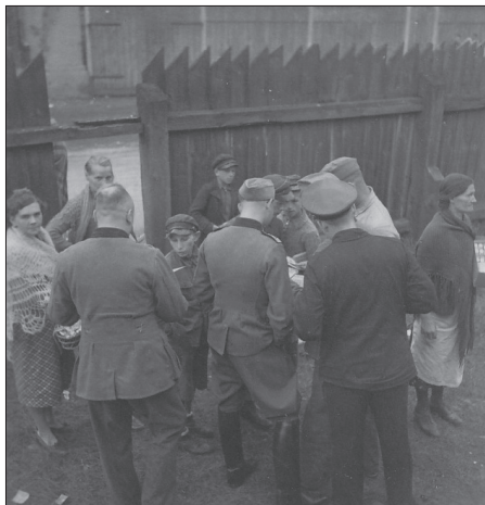
Białystok, getto, handel przy drewnianym parkanie