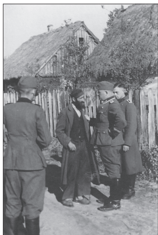
Region Białystok, poniżanie Żydów