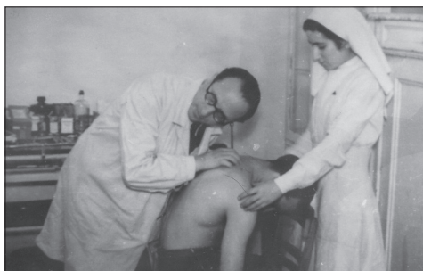
Białystok, miejscowy szpital

sytuacji i z desperacji zarząd Judenratu wydał zgodę na kultywowanie różnego rodzaju przydomowych ogródków 80 .