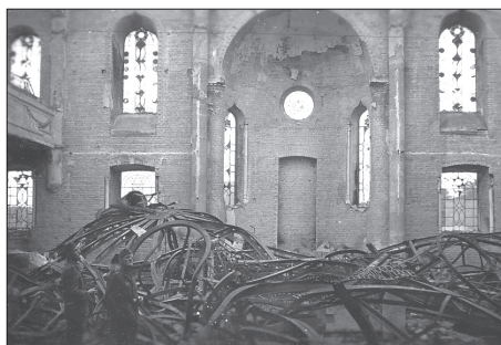
Niemcy w Wielkiej Synagodze po spaleniu

oraz domy, które następnie podpalano. Prawdziwa tragedia białostockich Żydów dokonała się 27 czerwca, w piątek – zwany też „krwawym piątkiem”. Tego dnia hitlerowcy podczas przeszukiwań rozstrzelali 250 Żydów 33 , a następnie zapędzili do dużej Synagogi przy ulicy Suraskiej około 800 osób: mężczyzn, kobiety, dzieci i ją podpalili 34 . Potem