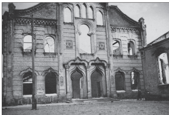
Wołkowysk, spalona synagoga 45