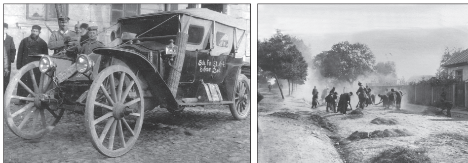
Białystok, żołnierze niemieccy w okresie I wojny światowej

– „podczłowieka” 4 , to spora część ich przełożonych miała już taki kontakt w okresie I wojny światowej 5 .