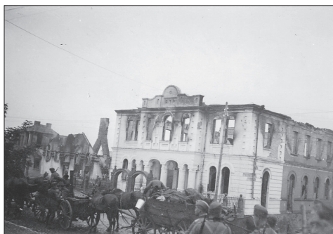
Synagoga w Grajewie 18