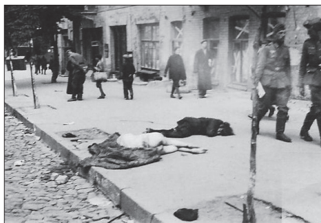
Wasilków, Żydzi zabici na ulicy