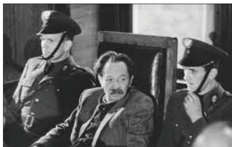
Koch przed sądem w Polsce 156