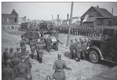
Brańsk, spalona Synagoga 42

Niemiecka propaganda oskarżała Żydów w Białymstoku jako współtwórców i organizatorów sowieckiej władzy w mieście i Regionie. Dlatego po jego zajęciu rozkazali im usunięcie wszystkich jej relikwów. Musieli oni strącać z miejskich cokołów ustawione tam posągi Włodzimierza Lenina (1870–1924), Józefa Stalina (1878–1953), symbole czerwonej gwiazdy, zrywać transparenty wychwalające komunizm. W dalszych działaniach, wzorowanych na praktykach z terenów okupowanego do 1941 roku GG, Niemcy ponownie przystąpili do pacyfikacji żydowskiej społeczności miasta. Kolejne akcje w Regionie również przyniosły mordowanie Żydów, grabieże ich mienia i palenie synagog.