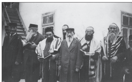
Żydzi z Suchowoli

dokonywali dalszych barbarzyńskich aktów. Pomiędzy 8 i 11 lipca gen. Erich von dem Bach-Zalewski (1899–1972) rozkazał komendantowi regimentu policji SS (316 i 322) Maxowi Montuaowi (1886–1945) aresztować i rozstrzelać poza miastem żydowskich chłopców i mężczyzn w wieku od 17. do 45. roku życia 35 . Także w Regionie trwała cykliczna niemiecka agresja, chociaż zdarzały się też przypadki, w których miejscowa ludność występowała przeciwko swoim sąsiadom 36 . Na całym przygranicznym pasie dochodziło do pogromów z inspiracji