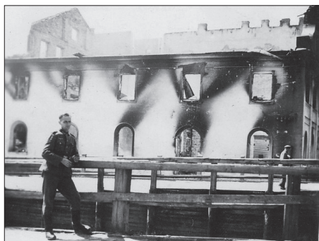
Białystok, spalona Synagoga Pułkowa 32