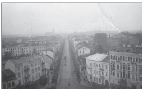
Białystok, ul. Lipowa