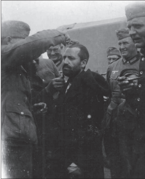
Region Białystok, poniżanie Żydów