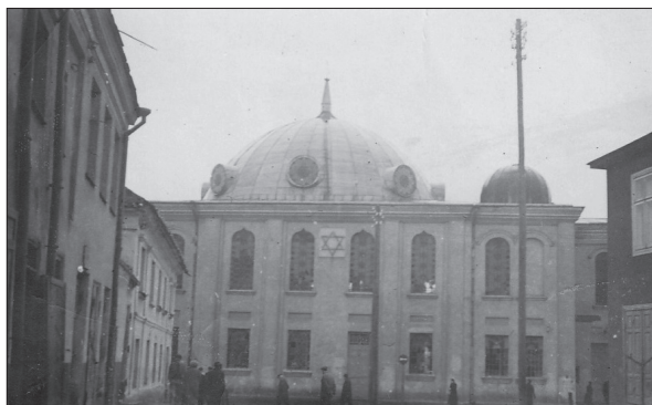
Białystok, Wielka Synagoga 10