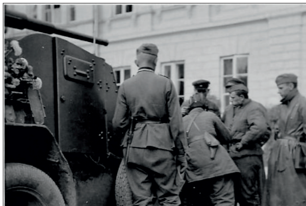
Żołnierze niemieccy i sowieccy przed pałacem Branickich w Białymstoku

bentrop-Mołotow 22 – doszło do spotkania pomiędzy Niemcami i Rosjanami oraz przekazania miasta Sowiecom.