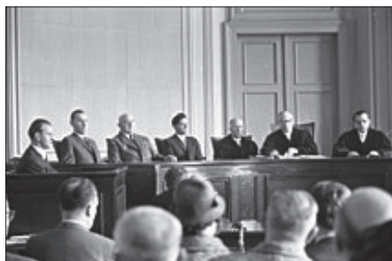
Proces Białostocki w Bielefeld 157