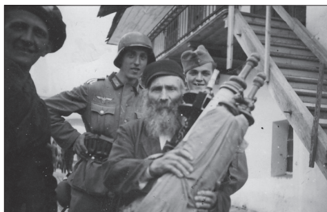
Żydzi z Suchowoli, palenie Tory