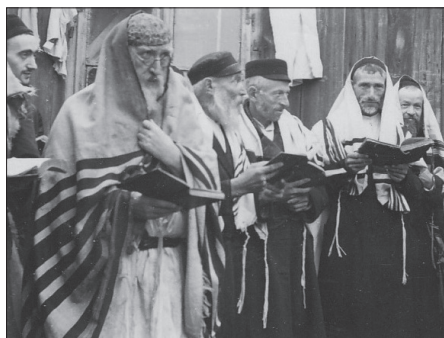
Żydzi z Suchowoli

dokonywali dalszych barbarzyńskich aktów. Pomiędzy 8 i 11 lipca gen. Erich von dem Bach-Zalewski (1899–1972) rozkazał komendantowi regimentu policji SS (316 i 322) Maxowi Montuaowi (1886–1945) aresztować i rozstrzelać poza miastem żydowskich chłopców i mężczyzn w wieku od 17. do 45. roku życia 35 . Także w Regionie trwała cykliczna niemiecka agresja, chociaż zdarzały się też przypadki, w których miejscowa ludność występowała przeciwko swoim sąsiadom 36 . Na całym przygranicznym pasie dochodziło do pogromów z inspiracji