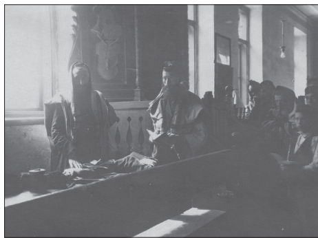
Sokołów Podlaski, dom modlitewny

zdjęciach został utrwalony wzór Żyda – „podczłowieka”. Jednak, obok doboru osób, dostrzeżemy również otoczenie, w jakim on żył, pracował i mieszkał.