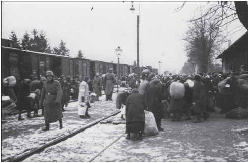
Białystok, „Akcja lutowa”

datnych do pracy – transportowano do pobliskich lasów oraz okolic i na miejscu mordowano: (...) skazańców wprowadzono do dołów i rozstrzeliwano. Wśród skazańców znajdowały się kobiety i dzieci 98 . Na prezentowanych poniżej zdjęciach zauważymy akt satysfakcji niemieckich żołnierzy, którzy stojąc obok ofiar nie wyrażają zdziwienia, a wręcz odwrotnie, zadowolenia,