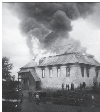
Kuźnica Białostocka, synagoga w płomieniach 48