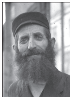
Białystok (Region), „podczłowiek”, typ wschodniego Żyda

mieckich obiektywach. Dokonane przez Niemców od września 1939 roku zapisy fotograficzne (prezentowane w artykule) stały się niemy i ważnym źródłem archiwalnym. Ikografia ta po części przybliży obraz enklawy białostockich Żydów w mieście i Regionie, ale również relacjonuje codzienność utworzonego tam później getta. Autor jak w kalejdoskopie przedstawia zdjęcie po zdjęciu – w trakcie działań wojennych z września 1939 roku i od czerwca 1941 roku do końca enklawy w sierpniu 1943 roku. Wszystkie fotografie zostały uzupełnione merytoryczną treścią, wprowadzającą czytelnika w świat ostatnich dni świata utraconego. W całej gamie umieszczonych poniżej zdjęć dostrzeżemy dwa obrazy – ten, którego wojna jeszcze nie naruszyła, oraz ten, który zmierza ku końcowi. W scenach ujętych w kadrach niemieckich aparatów zauważymy dobór osób i miejsc, zgodnych z ideologicznym oraz światopoglądowym ukształtowaniem młodych żołnierzy. Na prezentowanych poniżej