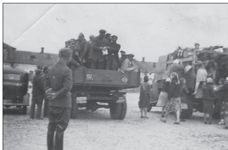
Białystok, transport śmierci

Kolejnym etapem, który przypadał na realizację planów eksterminacji, związanych z „Akcją Reinhardt” ( Einsatz Reinhardt, Aktion Reinhardt ) 94 na terenie GG i Regionie Białystok, była zorganizowana jesienią 1942 roku w mieście tzw. „akcja dziecięca”. Polegała ona na odebraniu rodzicom dzieci i wysłaniu ich do obozów Zagłady.