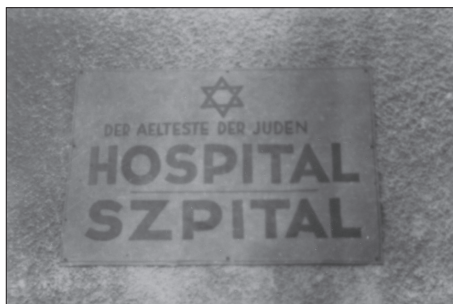
Białystok, miejscowy szpital