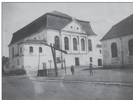
Synagoga w Stawiskach 14