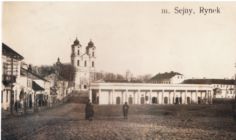
Il. 2. Sejny. Plac II

chem namiotowym. W roku 1828 na szczycie dachu umieszczono figurę jej patronki, św. Agaty. Kaplica, umieszczona w geometrycznym środku placu, znajduje się poza osią założenia dominikańskiego. Następnym wyodrębnieniem placu I – kościelnego z leja rozdroża było utworzenie trójkątnego, położonego niżej, placu II przed rynkiem, który w roku 1829 uzyskał akcent plastyczny w postaci klasycystycznych kramnic (21 kramów). Sukiennice murowane zwane kramnicami zostały wybudowane w latach 1828–1833 (1835?). Zlokalizowano je na pustym, bagnistym placu między dwoma rynkami: kościelnym i targowym. Budynek był parterowy, dwutraktowy o wystroju klasycystycznym, wzniesiony na planie nieregularnej podkowy o ściętych narożnikach. Pulpitowe dachy pokryto dachówką, od frontu były zasłonięte niską attyką. W trakcie zewnętrznym mieścił się szeroki podcień wsparty na kolumnach doryckich. Plac z kramnicami został zwężony do 30 m, gardłem prowadził pod górę pojazdy i kierował wzrok na rynek (plac III) 18 (Il. 2, 3). Kramnice rozebrano w latach 1939–1944.