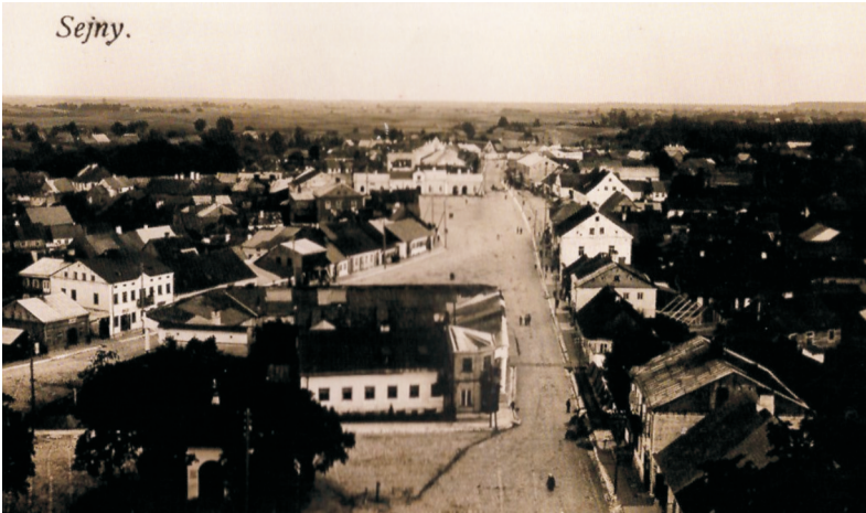
II. 3. Sejny. Plac II i III, fot. ze zbiorów Archiwum Akt Dawnych

Następowały dalsze zmiany mające na celu uporządkowanie szerokiego targowiska, zarazem głównej arterii komunikacyjnej miasta. Prawdopodobnie w 1770 r. na tym placu dominikanie wzniesli murowany ratusz. Z fragmentarycznych wzmianek wynika, iż był to budynek dwukondygnacyjny na rzucie prostokąta, kryty dachem czterospadowym. Kolumny podcieni ratusza zastępowały pręgierz. W przyziemiu mieściły się zapewne kramy i zajazd, a na piętrze siedziba land wójta.