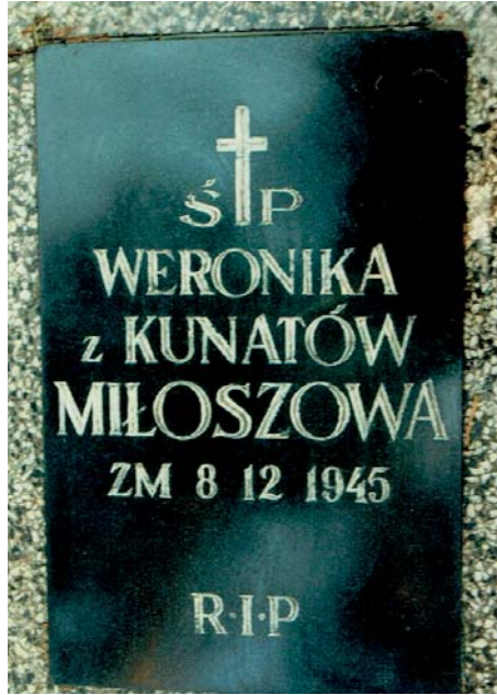
Tablica nagrobna Weroniki Miłosz na cmentarzu w Sopocie.