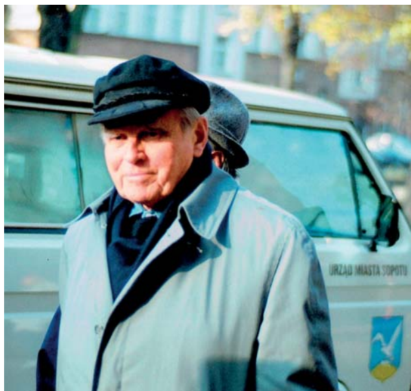
Cz. Miłosz przed Urzędem Miasta w Sopocie, 1993.