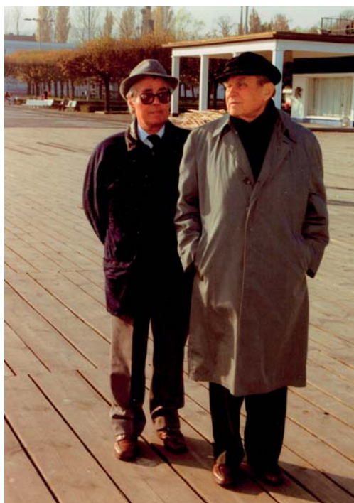
Cz. Miłosz z Z. Lipińskim na sopockim molo, 1996.