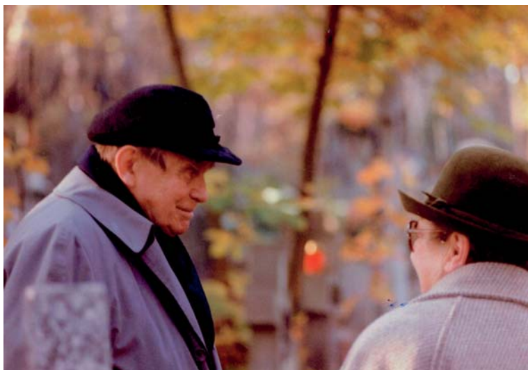
Cz. Miłosz spotyka repatriantkę na sopockim cmentarzu, listopad 1993.