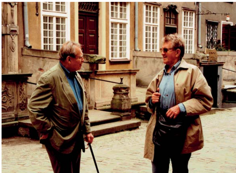
Bracia A. i Cz. Miłoszowie na Mariackiej w Gdańsku, 1995.