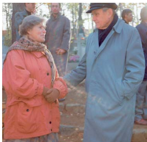
Cz. Miłosz spotyka na sopockim cmentarzu repatiantkę z Litwy, listopad 1993.