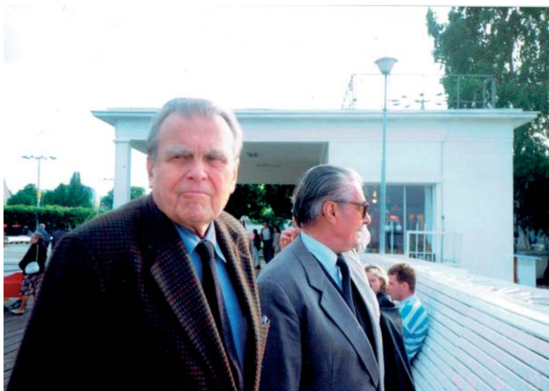
Cz. Miłosz i Z. Lipiński na molo w Sopocie, czerwiec 1995.