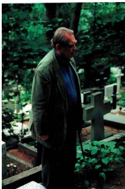
Cz. Miłosz przy grobie matki na cmentarzu sopockim, czerwiec 1995.