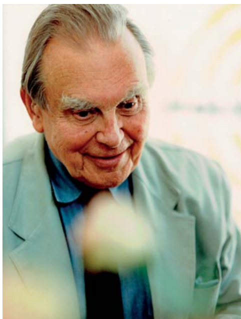
Czesław Miłosz podczas promocji książki „ Aj, moi dawno umarli ”, Sopot 1996.