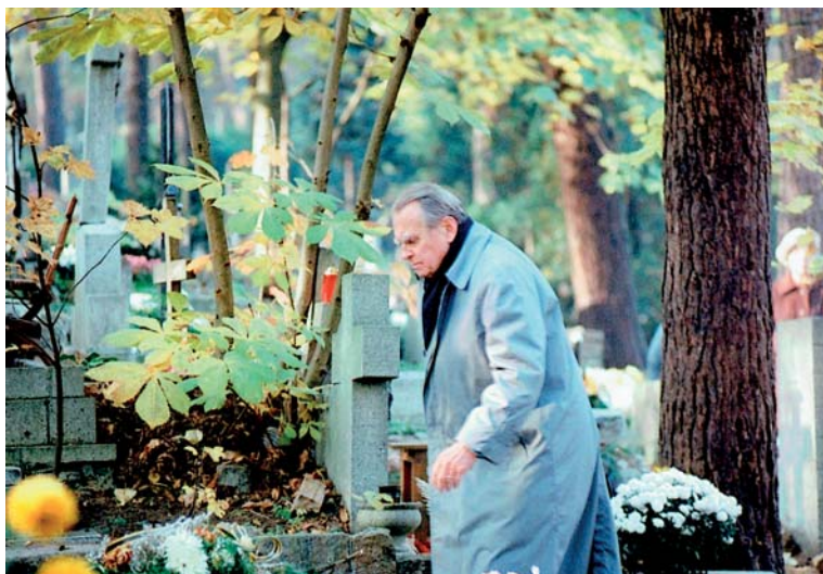
Na cmentarzu w Sopocie nad grobem matki, 1993.