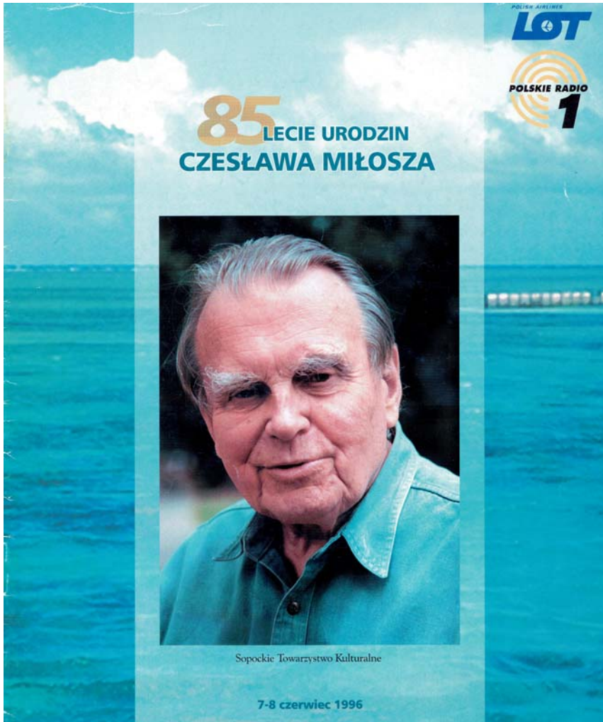
Okolicznościowa publikacja z okazji 85. rocznicy urodzin Czesława Miłosza, Sopot 1996