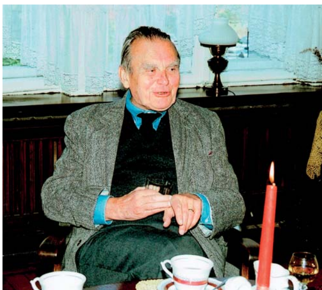
Cz. Miłosz w saloniku prezydenckim w Sopocie, 1993.