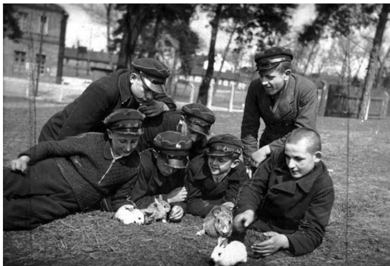
Fot. 1. Podopieczni Zakładu Wychowawczego Rodziny Kolejowej w Maczkach (wrzesień 1938 rok)

Stowarzyszenie było również założycielem trzech zakładów wychowawczych. Należały do nich: Zakład Wychowawczy Rodziny Kolejowej w Aleksandrowie Kujawskim, Zakład Wychowawczy Rodziny Kolejowej w Maczkach oraz Zakład Wychowawczy w Przemyślu. Wszystkie były przeznaczone dla sierot po zmarłych kolejarzach. Ośrodek w Aleksandrowie Kujawskim przeznaczony był dla 50 dziewcząt, z kolei w dwóch pozostałych mogli przebywać chłopcy.