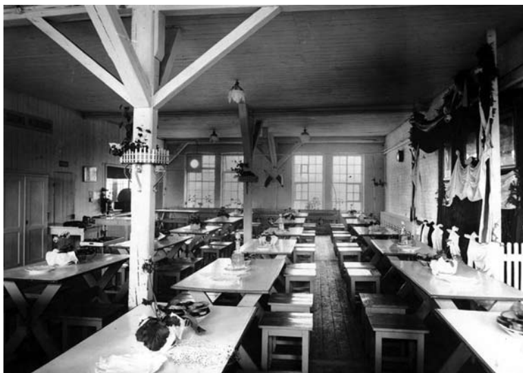
Fot 2. Stołówka Rodziny Kolejowej w Radomiu

W październiku 1938 roku w Gdyni przy ul. Okrężnej otwarto nowoczesną stołówkę RK 31 . Podobne powstawały w innych miejscowościach.