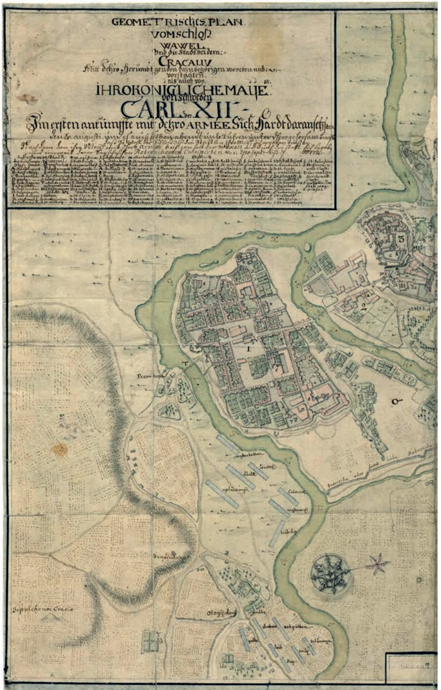
Ryc. 4. Geometrisches Plan vom Schloss Wawel und die Stadt bei dem Cracau... (1702), Riksarkivet, Krigsarkivet, Sveriges Krig 1521–1864, Stora Nordiska krig 1699–1721, sygn. 182b. Punkt obserwacji Mathiasa Palbitzkiego odnotowany jest na mapie pod nr 4, w obrębie miasta Kazimierza