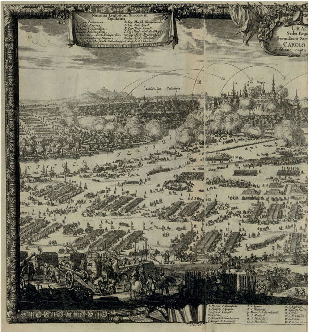
Ryc. 5. Erik Dahlbergh, Cracovia Sedes Regia obsessa et a Serenissimo Sveo. Gothorum Rege Carolo Gustavo deditioe capta d. 8 Octob. Anno 1655 , Nürnberg 1696. Biblioteka Narodowa, sygn. ZZK 18 686