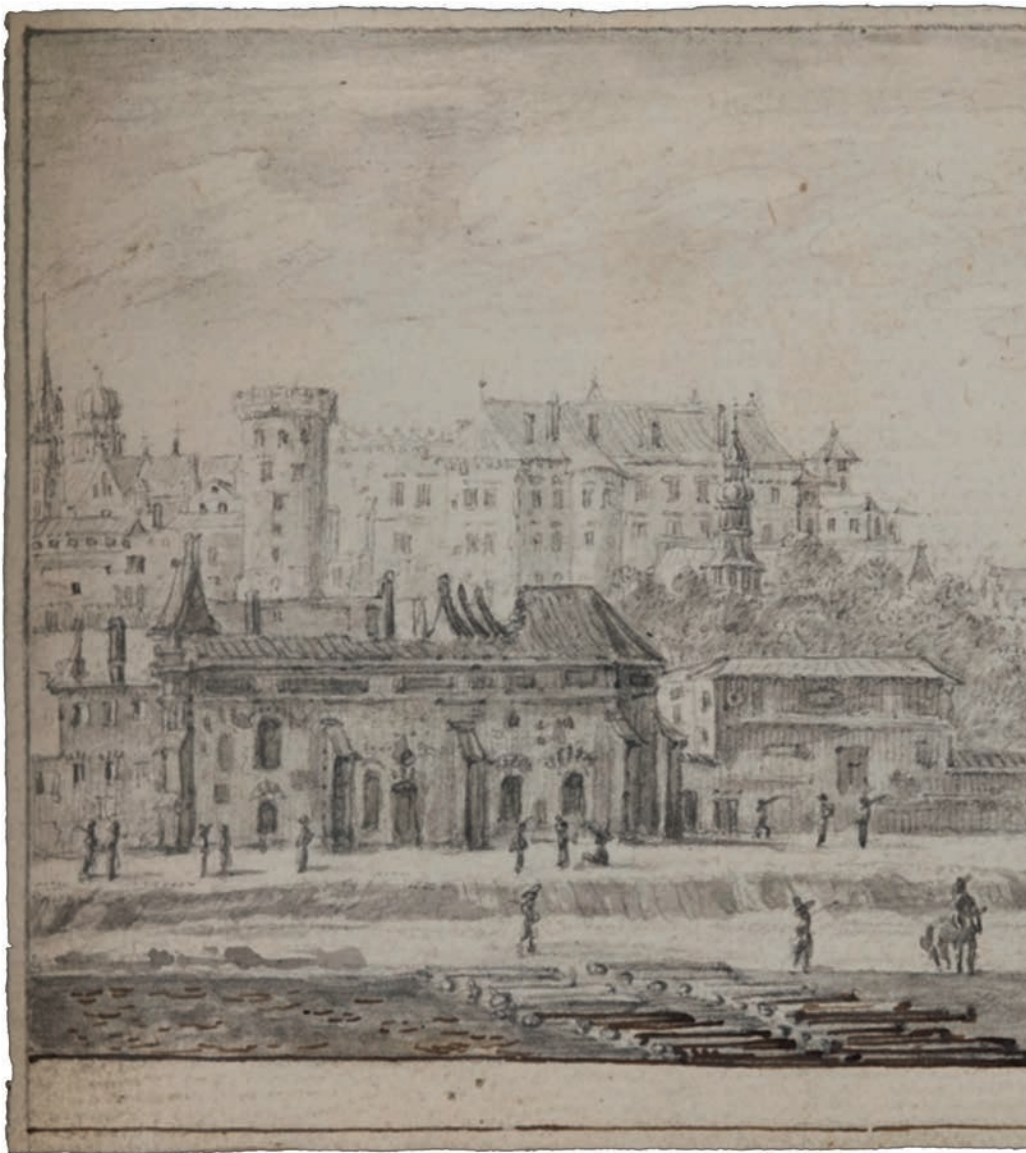
Ryc. 3. Widok Krakowa wykonany przez Mathiasa Palbitzkiego z okna klasztoru ojców augustianów. Mathias Palbitzki's skissbok , Östergötlands museum, OM.OML.004573

odbył w latach 1644–1648 podróż po zachodniej i południowej Europie oraz ziemiach Porty Otomańskiej. Po powrocie do Sztokholmu prowadził misje dyplomatyczne w Wenecji, Toskanii, Hiszpanii, Francji, Rzeczypospolitej, w Rzeszy i na terenie Niderlandów. Był miłośnikiem sztuki i jednocześnie agentem artystycznym 24 .