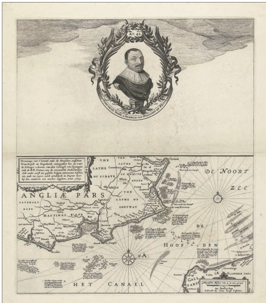
Ryc. 1. Fragment ryciny Claesa Jansz. Visschera – popiersie admirała Maartena Trompa oraz mapa przedstawiająca ruchy flot na Kanale La Manche

postrzegane jako pojedynek Dawida z Goliatem. Porównanie samych okrętów flagowych rzuca pewne światło na to zagadnienie – Aemilia ( Amelia ) Trompa miała tonaż zaledwie 300 łąszków (600 ton), podczas gdy Santiago admirała Oquendo aż 800 łąszków (1600 ton) 11 . Dysproporcje wspomniane w źródłach pisanych znakomicie oddaje datowana na lata 1642–1665 rycina anonimowego