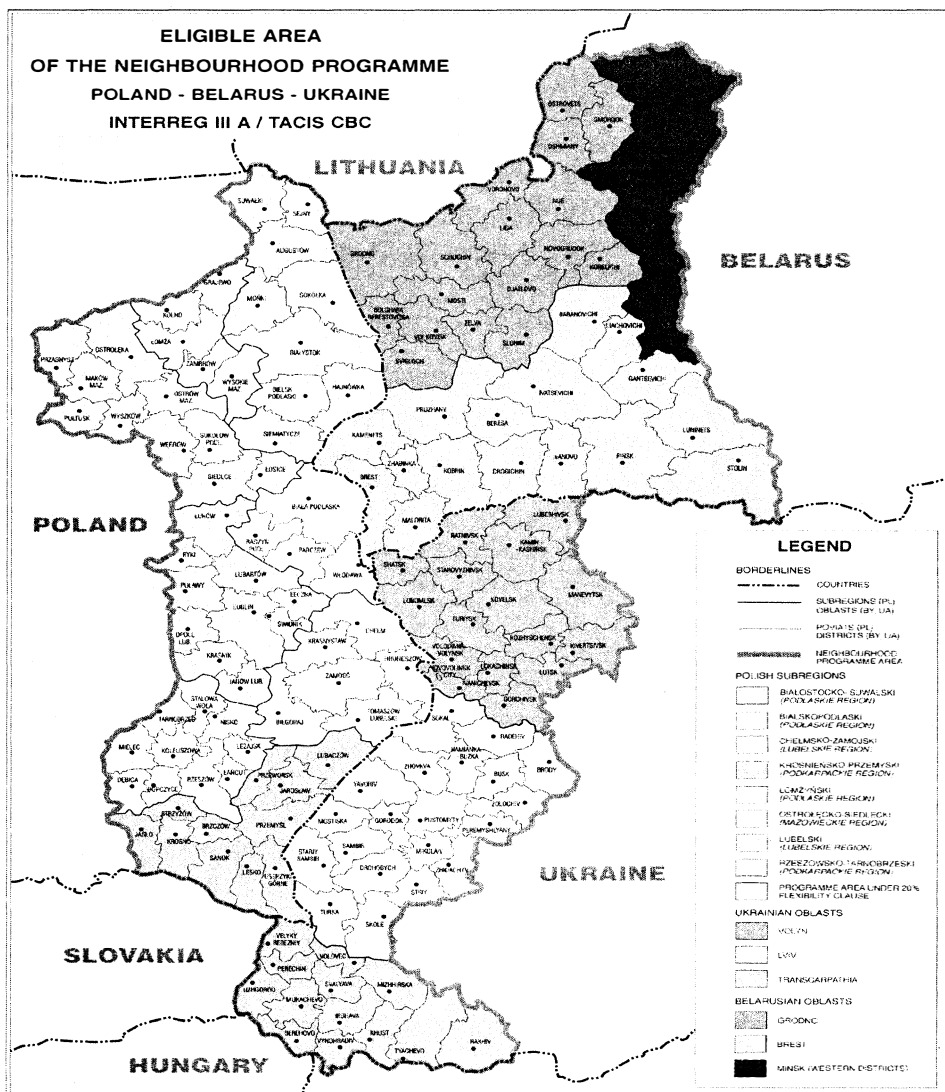
Rys. 1. Program sąsiedztwa Polska–Białoruś–Ukraina Interreg IIIA/TA-CIS CBC 2004–2006

Długość polsko-białoruskiej granicy wynosi 418,25 km, a polsko-ukraińskiej 535,18 km.