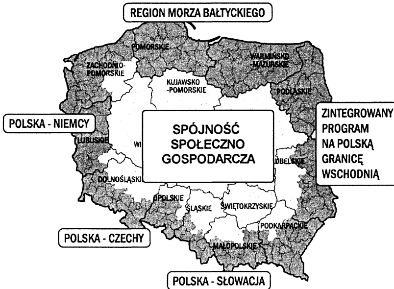
Rys. 1. Zasięg przestrzenny poszczególnych komponentów Phare CBC