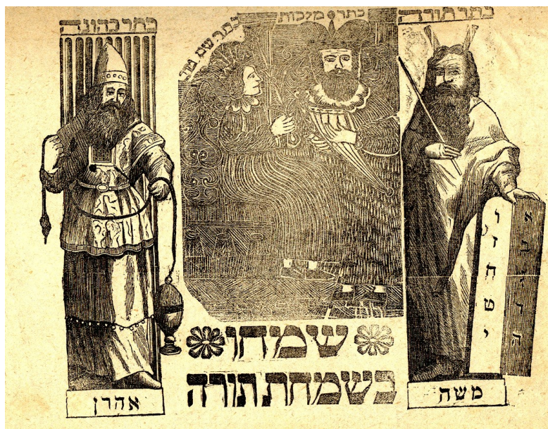
Il. 5: Chorągiewki na Simhat Tora, Lwów, druk: Jakub Ehrenpreiss, po 1866 r.