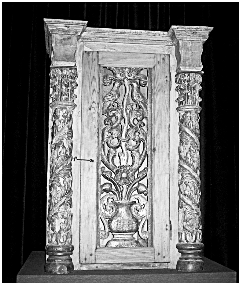
Il. 3: Szafa na zwoje Tory, Wysokie Litewskie, Polska, XVIII i XIX w.