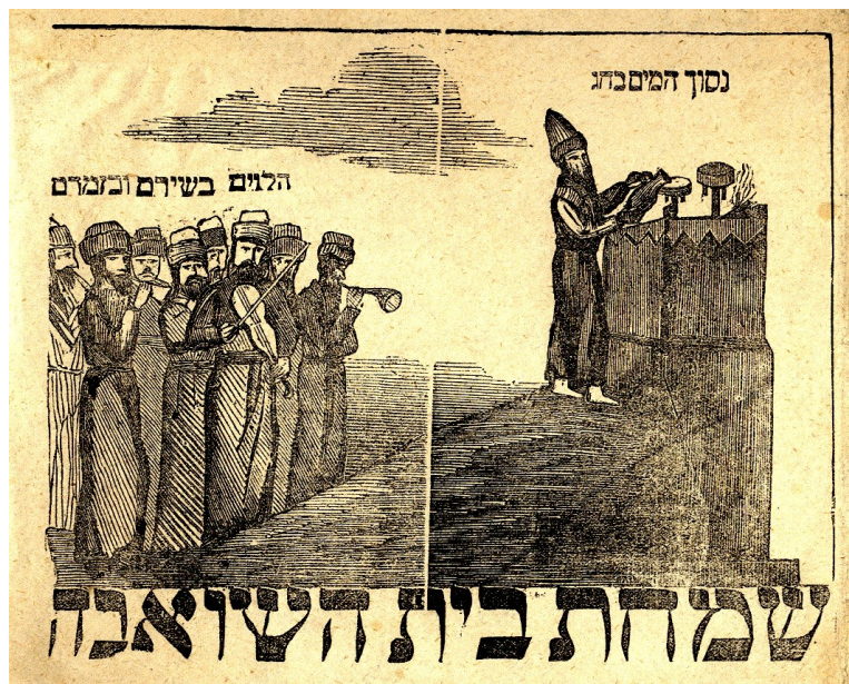
Il. 6: Chorągiewki na Simhat Tora, Lwów, druk: Jakub Ehrenpreiss, po 1866 r.