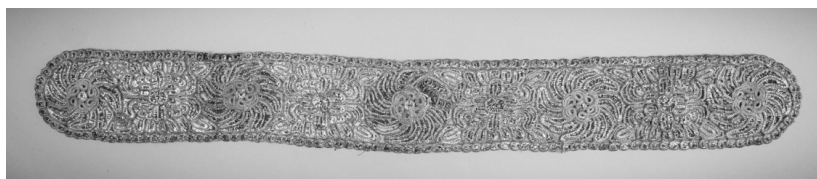
Il. 2: Atara, Sasów (?), Polska, XIX w.