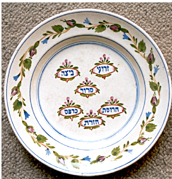
II. 1: Talerz sederowy, Potylicz, Polska, 2 poł. XIX w.

Podsumowując powyższy przegląd zabytków, skonstatować należy, iż w zbiorach muzealnych znajduje się wiele cennych i wartościowych pod względem poziomu artystycznego wytworów żydowskiego rzemiosła. Autorami tych przedmiotów byli Żydzi, anonimowi artyści i rzemieślnicy, po których pozostały jedynie piękne przedmioty. Znaczna część tego dziedzictwa kulturowego zaginęła lub została zniszczona w czasie II wojny światowej, jedynie część przetrwała w zbiorach muzealnych dzięki staraniom, zapobiegliwości i trosce pokoleń muzealników.