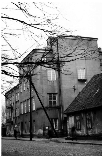
Seminarium Duchowne przy ul. Słonimskiej 8 w Białymstoku

Fakt likwidacji uczelni przez władze państwowe nie zatarł chlubnych tradycji wydziałowych ani pamięci o niej wśród profesorów, a także absolwentów. Niecałe 30 lat funkcjonowania Wydziału Teologicznego USB w Wilnie i Białymstoku pozostawiło trwałe ślady w dziejach Archidiecezji Wileńskiej i całej północno-wschodniej Polski.