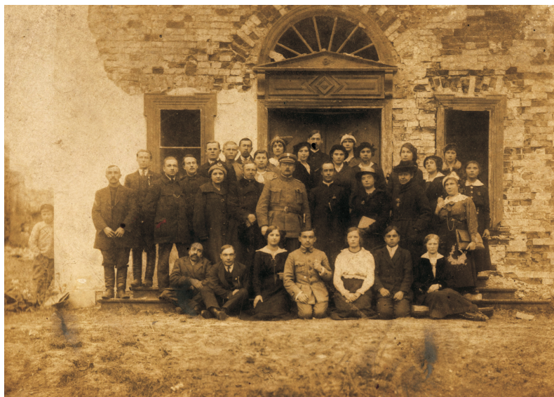
Il. 6. Przed ruinami zameczku w Ciechanowcu. Dwudziestolecie międzywojenne.