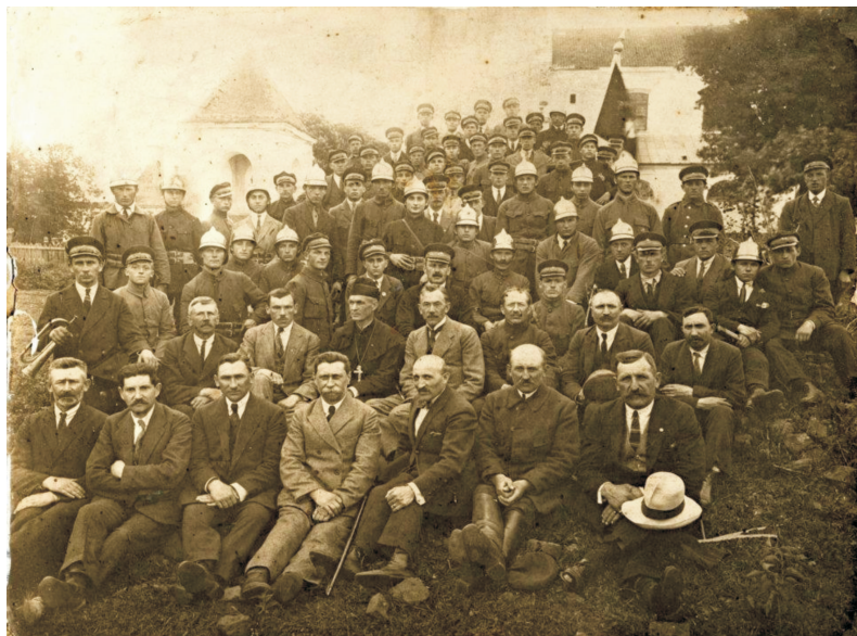
Il. 3. Ochotnicza Straż Pożarna w Ciechanowcu, przed 1915 r.

wały się fotografie wiernych przed murami kościoła pw. Trójcy Przenajświętszej w „grodzieńskim” Ciechanowcu. Kilka przedstawia wnętrze ciechanowieckiej świątyni z lat pierwszej wojny. Do tego dochodzą spacerujący ludzie na terenie „zameczku” i członkowie lokalnej straży pożarnej. Są to perełki wśród innych pozyskanych zabytkowych fotografii.