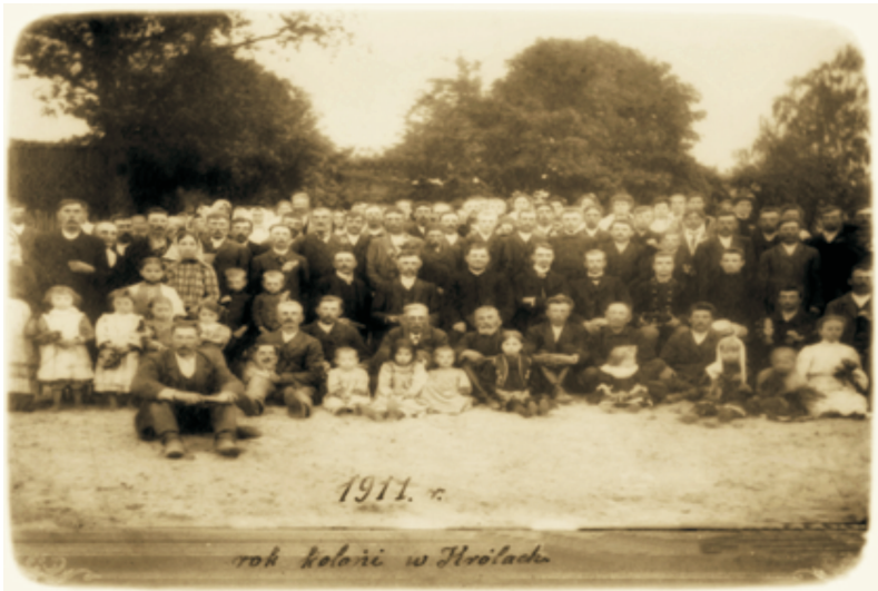
Il. 4. Scalanie gruntów we wsi Radziszewo-Króle. F. Rogozik, 1911 r. (Zbiory Zbigniewa Radziszewskiego)

może się znajdować wśród sfotografowanych również prekursor ciechanowieckich fotografów.