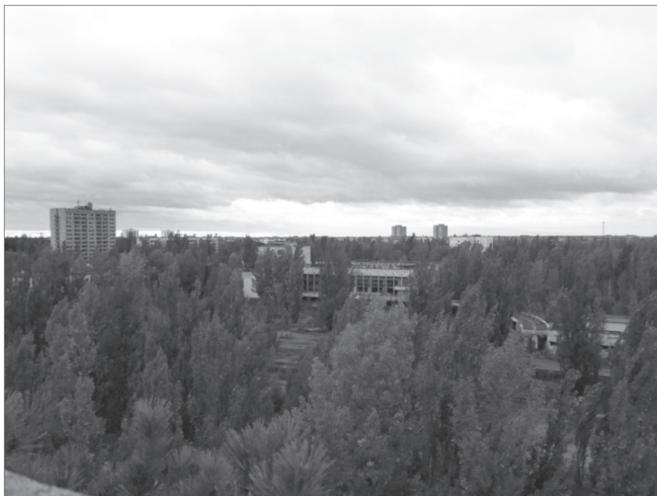
Zdjęcie 3. Centrum miasta Prypeć (2018)

Poniżej zdjęcia z miasta i okolicznych wsi pochodzące z prywatnych zbiorów, wciąż aktualizowanych przy okazji cyklicznych wyjazdów do tego miejsca.