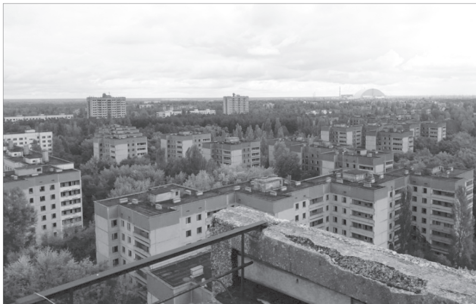
Zdjęcie 4. Widok z jednego z wieżowców (w tle tzw. arka zabezpieczająca elektrownię)