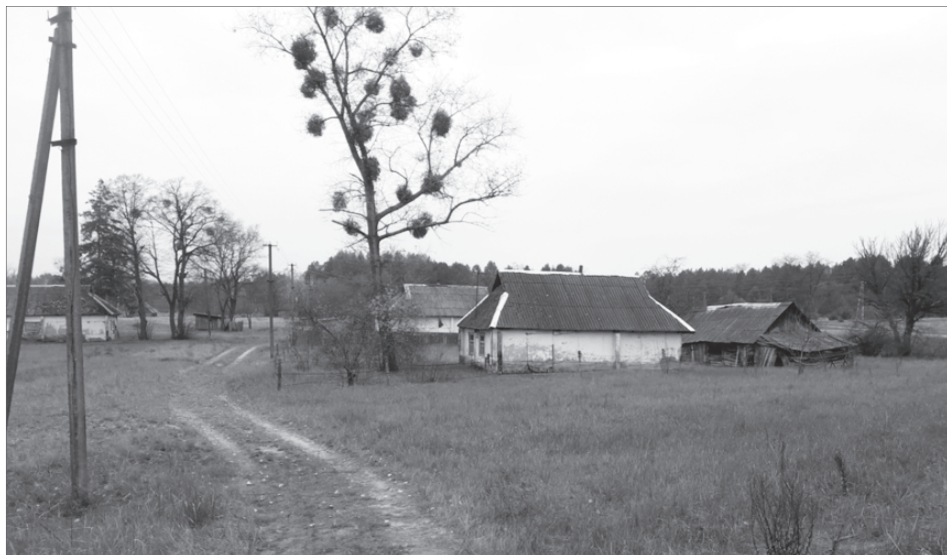
Zdjęcie 5. Wieś Kupowate (obecnie)