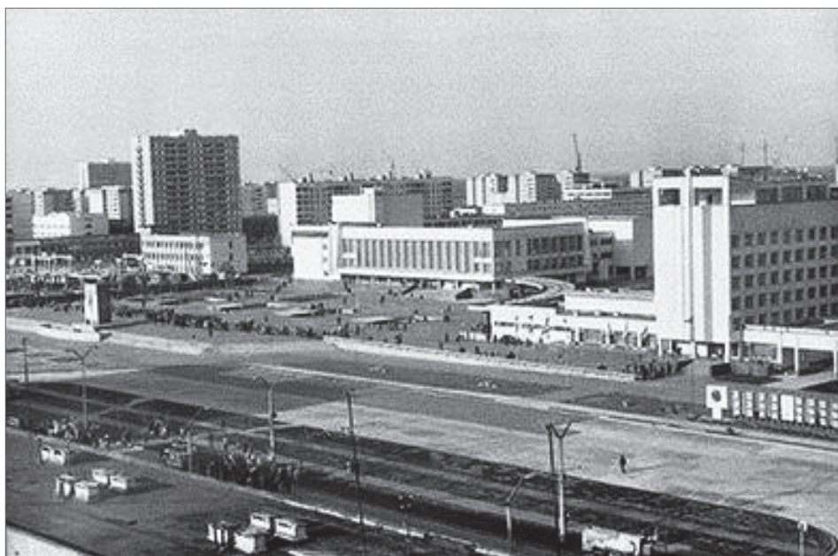
Zdjęcie 2. Centrum miasta Prypeć (przed wypadkiem)