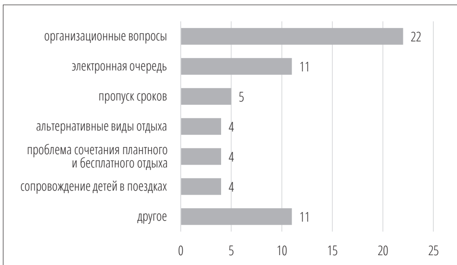
Рисунок 2. Распределение по тематике негативных отзывов клиентов ГАУК «МОСГОРТУР» по поводу содержания и качества услуг по отдыху и оздоровлению детей в ТЖС в 2019 году