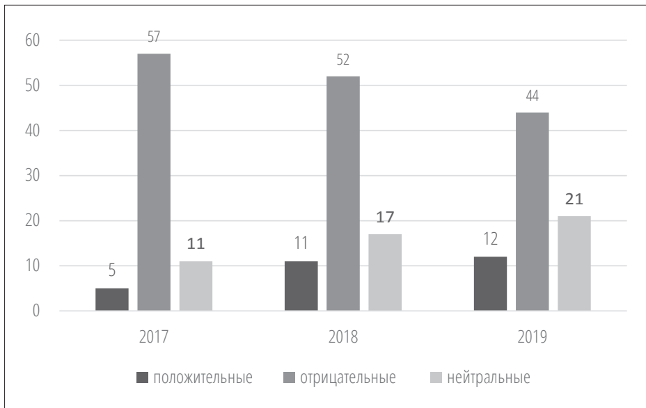
Рисунок 1. Отзывы клиентов ГАУК «МОСГОРТУР» по поводу содержания и качества услуг по отдыху и оздоровлению детей в ТЖС в 2017–2019 годах в социальных сетях