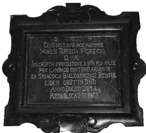
Ryc. 5. Wmurowana tablica upamiętniająca Teresę Wydrzycką w białostockim kościele pw. Wniebowzięcia Najświętszej Maryi Panny z 1717 r.

początku XVIII w. Żydzi wydzieleni byli spod władz miejskich białostockich i podlegali bezpośrednio pod zwierzchnią władzę zamkową 83 .