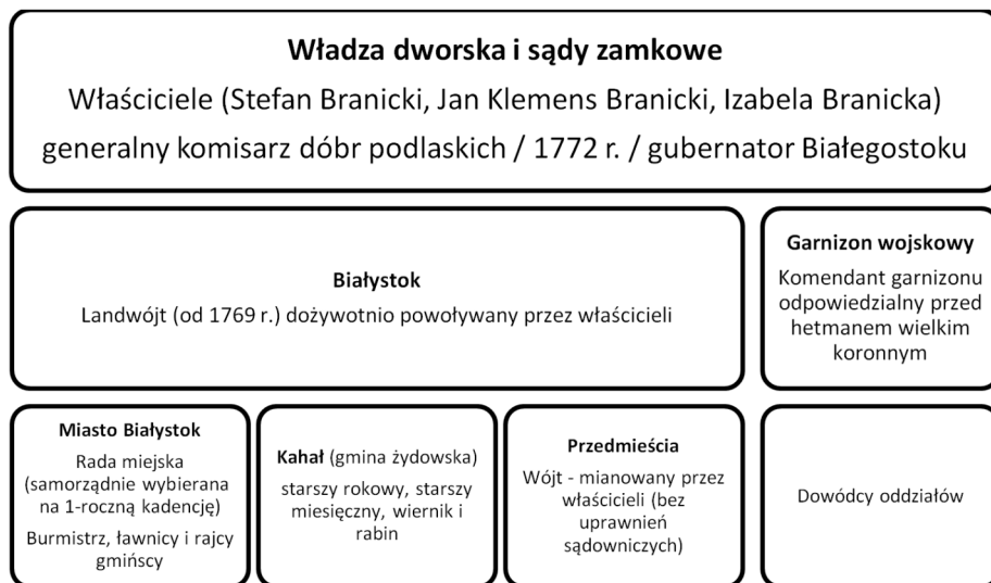
Ryc. 6. Hierarchia urzędów istniejąca w Białymstoku w drugiej połowie XVIII w. (do 1795 r.).

men, a cały proces został zakończony wydzierżawieniem przez Izabelę Branicką królowi pruskiemu Białegostoku w 1802 r.