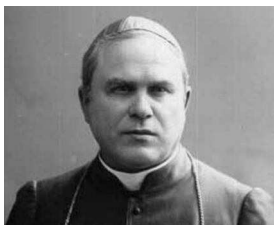
abp Jan Cieplak 14 XII 1925 – 17 II 1926