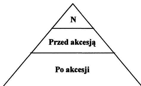
Rysunek 3. Trójkąt adaptacji

Należy zaznaczyć, że przemiany instytucjonalne w Polsce w okresie transformacji ustrojowej uwarunkowane są bodźcami wewnętrznymi i zewnętrznymi. Posiadają one duże znaczenie w procesie adaptowania polskich obszarów wiejskich do zmieniających się warunków gospodarowania. Proces adaptacji instytucjonalnej zaprezentowany został na rysunku 3.