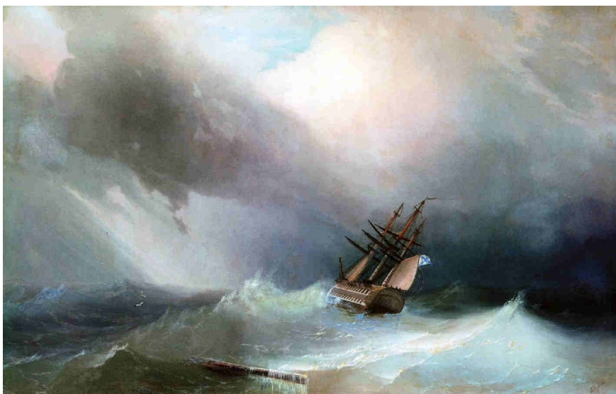
Iwan Ajwazowski, Szstorm (1851)