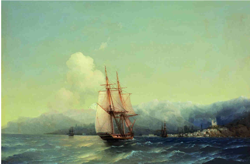
Iwan Ajwazowski, Krym (1852)