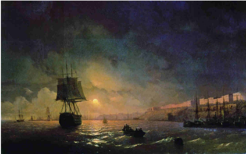
Iwan Ajwazowski, Widok Odessy w księżycową noc (1846)