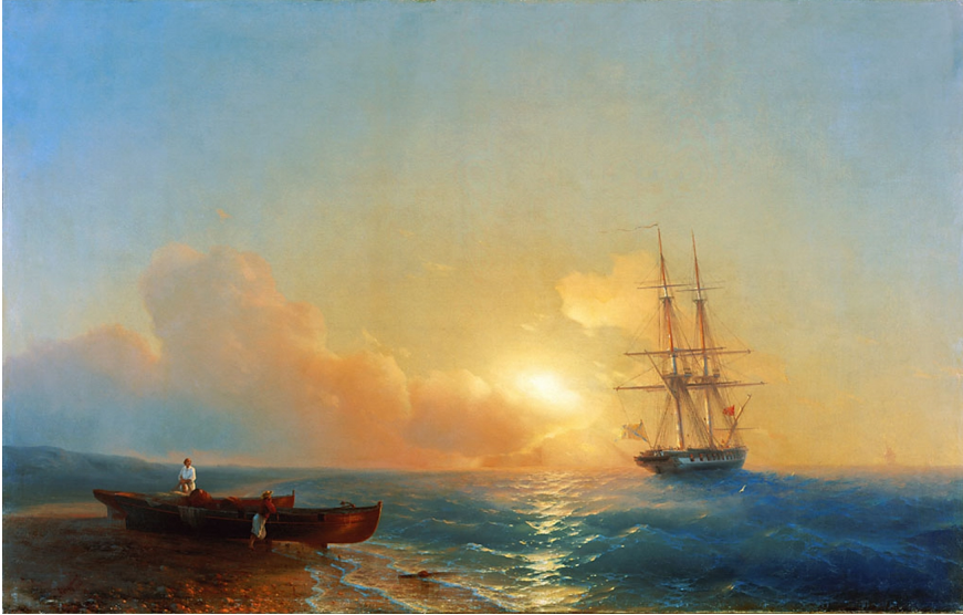
Iwan Ajwazowski, Rybacy na brzegu morza (1852)