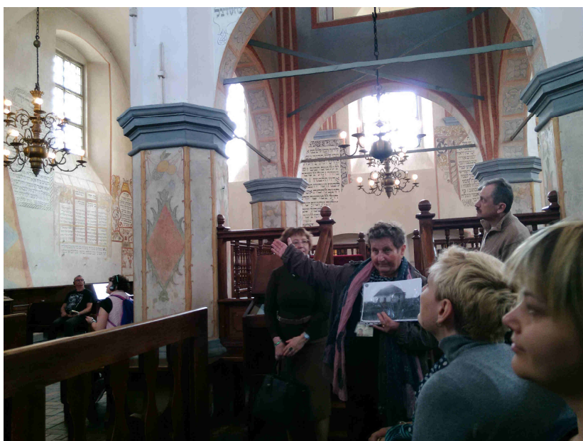
W Wielkiej Synagodze w Tykocinie