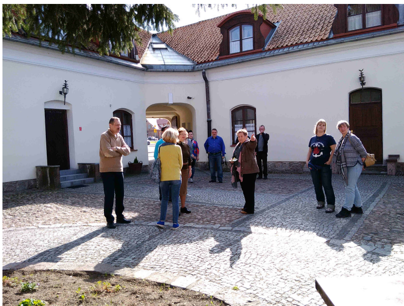
Uczestnicy Konferencji zwiedzają Tykocin