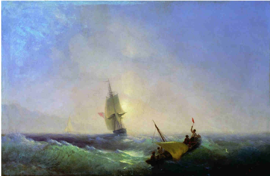
Iwan Ajwazowski, Uratowani z katastrofy (1844)